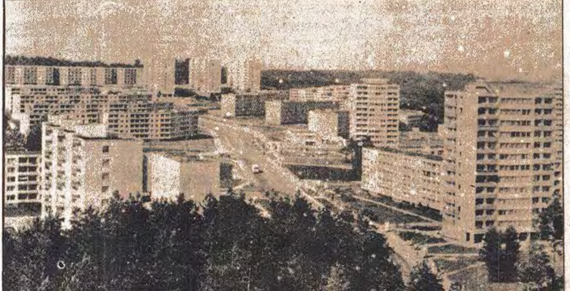
Sovyetler Birliği'nde eğitim sağlık ve diğer toplumsal ihtiyaçları geli konut ve yerleşme ihtiyacı da planlı olarak...