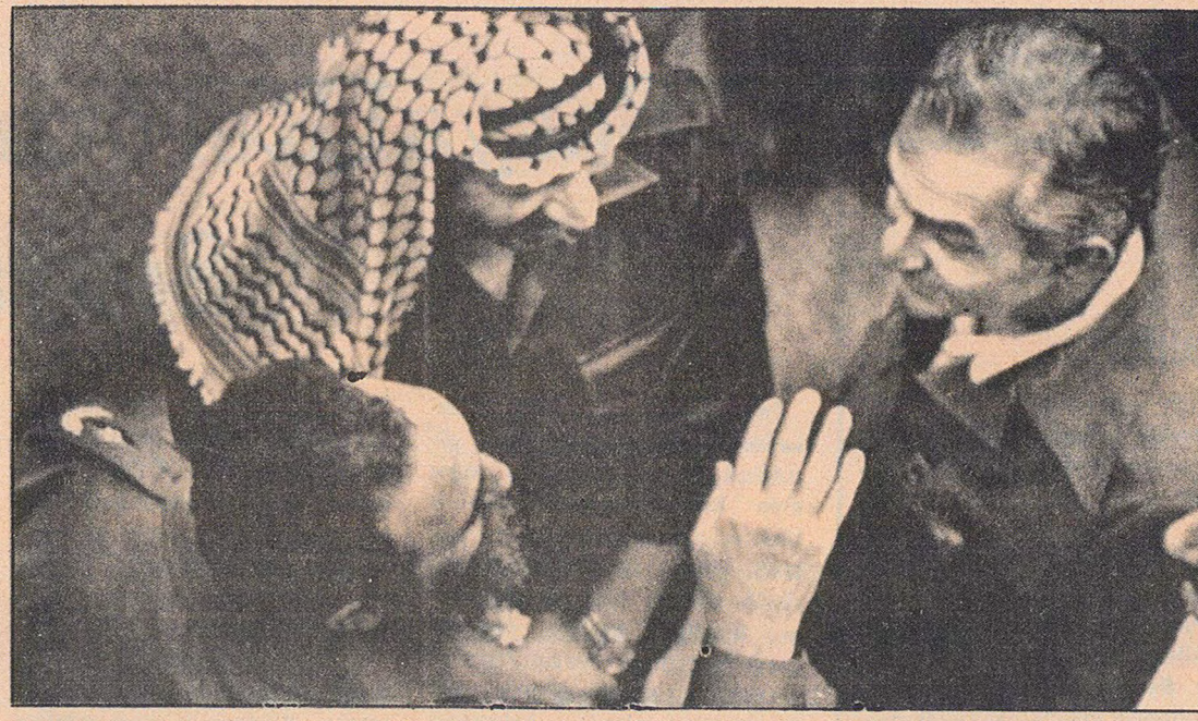
FKÖ Lideri Yasser Arafat Fidel ile

Dünyanın çeşitli ülkelerinde imal edilen paraların kağıtlarının genellikle aynı kaynaktan sağlandığını belirten yetkililer, «Yapılan testler bir banknotun 3400 defa çift katlamaya dayanıklı olduğunu bildirmektedir. Ancak Türkiye'de cüzdan yerine banknotların ceplerde, göğüsde, keselerde, ayakkabı ve çorap içinde taşınması çok çabuk eskimesine neden olmaktadır. Ayrıca banknotların üzerine yazı ve resim çizilecek kullanım değeri tamamen yok edilmektedir» demektedirler.