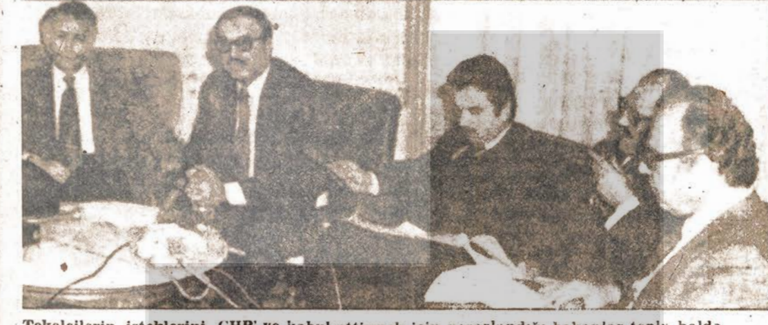
Tekelcilerin isteklerini CHP'ye kabul ettirmek için yararlanıldığı bakanlar toplu halde.

17 SAAT SÜREN BAKANLAR KURULU TOPLANTISINDAN SONRA «HÜKÜMETİN BİRLİK VE DAYANIŞMA İÇİNDE» OLDUĞU İLAN EDİLDİ