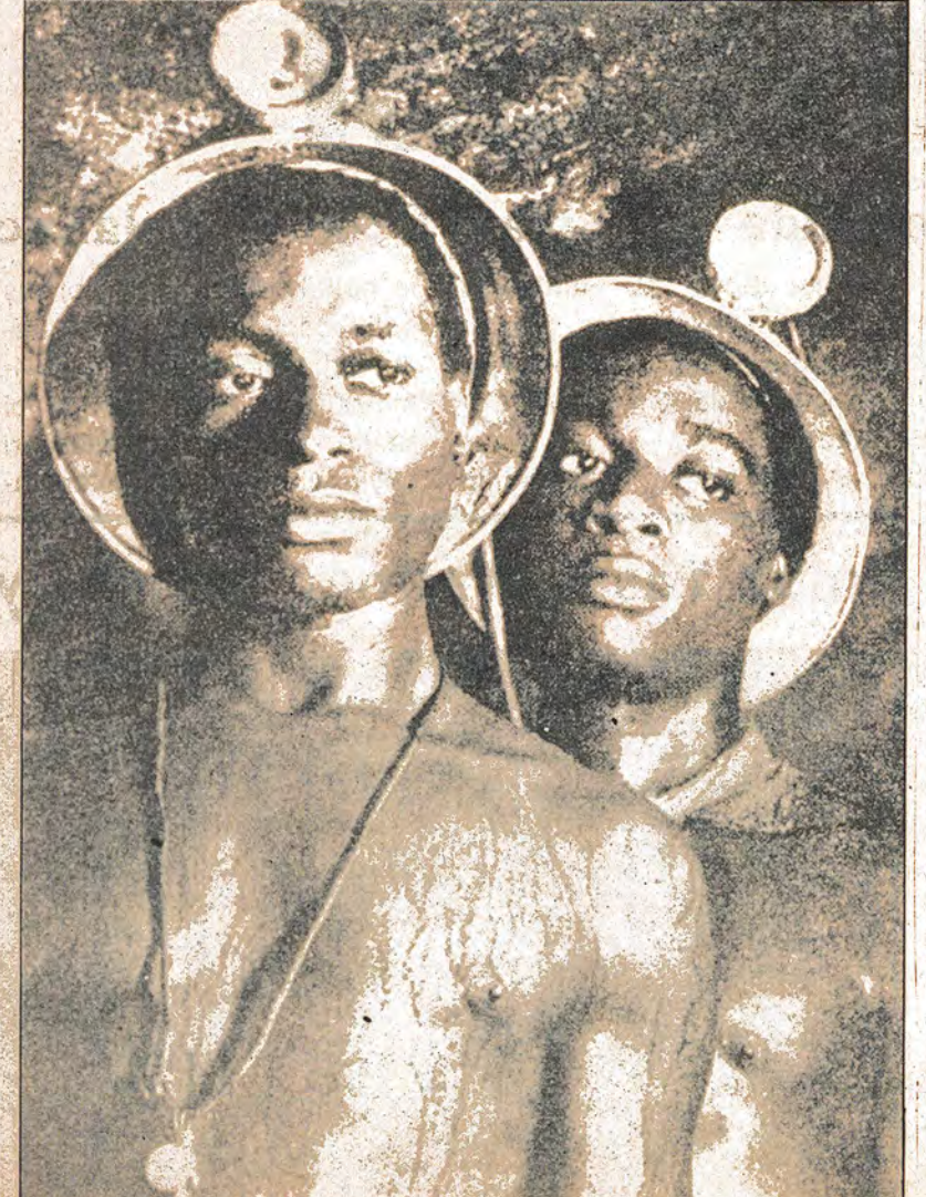
AFRIKA DA DA SON SÖZÜ HALK GÜÇLERİ SÖYLEYECEK

mazlıkların görüşmelerle lirtmiş ve birçok meseledehalledilmesini istemek, ge- ki tutumuyla açıkça ortaya