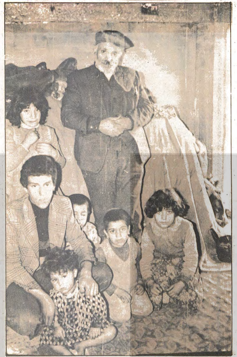
Fotoğrafta depremin ve burjuvasinin hışmına uğrayan bir aile görülüyor.

Van Depreminden son ra Sakarya'ya yerleştirilen deprem felaketzadeleri kiş günü her yanı açık, penceresi olmıyan inşaatların zemin katlarında açlık ve sefalete itilmiş bir durumda bulunmaktadır -