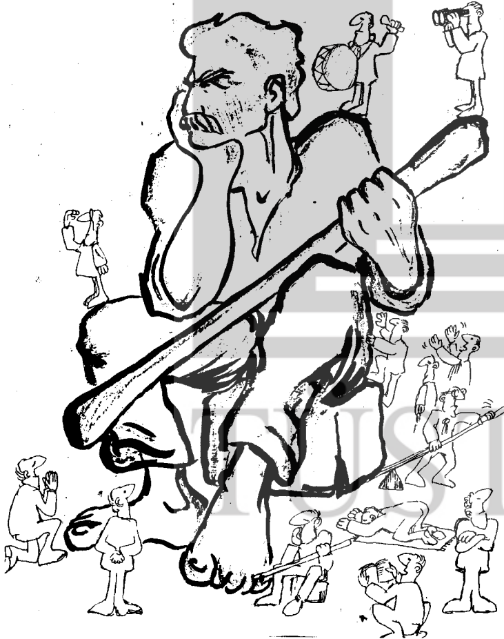
DEVAMI "SAFLAŞMA" DÖNEMİNDE ÇİZİLMESİ GEREKEN TAMAMLANMAMIŞ BİR KARİKATÜR

Emekçi halkımızın ve özel olarak işçi sınıfının kopmaz birer parçası olan biz devrimci gençlik olarak Değirmenciler fabrikası işçilerinin daima yanlarında olduğumuzu bildiriyoruz.