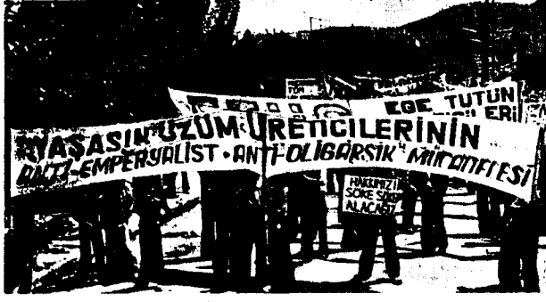
ALAŞEHİR'DE ÜZÜM ÜRETİCİLERİ MİTİNGİ YAPILDI.

Derinleşen buhranın yükünü emekçi halkımızın sırtına yüklemek, emekçi kitlelerin sömürüne karşı kavgarlarını bastırarak için oligarşik dikta her gün yeni oyunlar tergalıyor. Bunun en açık örneği de bu yıl uygulanan taban fiyat politikasıdır. Hayat pahalılığı geçen yıla oranla % 30 oranında artarken, her gün yeni bir mala zam gelirken, piyasada bir sürü mal karaborsaya düşmüşken açıklanan taban fiyatları geçen yıla oranla komik bir artış öngörmektedir. Mesela bugdaya verilen 10 kuruşluk fark, üzüme verilen 50 kuruşluk fark artan maliyetler ve fiyatlar karşısında halkımızın yoksulluğuna yoksulluk eklemektedir. Pamuk taban fiyatının, ayçiçeği taban fiyatının zamanında açıklanmaması üreticileri tefecinin