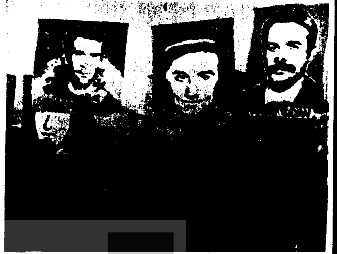
1 MAYIS İŞÇİ SINIFININ DEVRİM SEHİTLERİNİ BAGRINA BASTIĞI GÜN OLDU. DEVRİM SEHİTLERİMİZ BAYRAMI, BAYRAM ONLARI YOCELTTİ. ONLARIN HALKIMIZIN KURTULUSU İÇİN VERDİKLERİ MÜCADELE TOM. DEVRİMCİLERE ÜNDER OLSUN.

Sonuç olarak 1 Mayıs eylemi işçi sınıfının devrimci eylemi açısından ileri bir aşamayı oluştururken, devrimciler için sayısız deney ve tecrübeyi de getirmiştir.