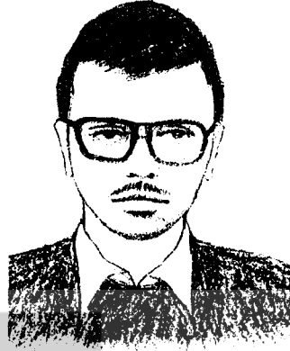
O ÖNÜMÜZDEYDİ, EN ÖNDE...

Selam O'na! Ve bu mücadelede hayatlarını kaybedenlere... BİN SELAM!