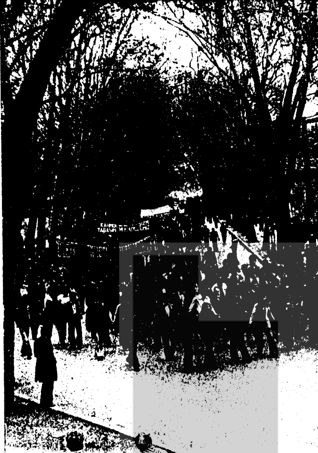
DEVRİMCİ GENÇLİK KURTULUŞ MÜCADELESİNDE EMEKÇİ HALKIMIZIN YANINDADIR

51 yıllık bir aradan sonra Türkiye İşçi Sınıfı tüm emekçi halk ve devrimcilerle birlikte 1 Mayıs'ı büyük bir coşku içinde kutladı. İşçi sınıfının görkemli gücü bir kez daha vurgulandı. İstanbul o gün tümüyle çelik disiplini ve devrimci sloganlarıyla yüzbinlerce işçinin-di.