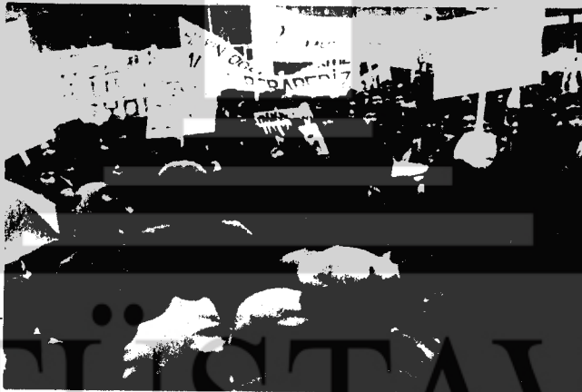
TOM YURTTA AKTIF KİTLE DİRENİŞLERİNİ ÖRGÜTLEYELİM. FAŞİZMİN BASKI VE TERÖRÜ MÜCADELEMİZİ DURDURAMAZ.

Salonda bulunan Millî Eğitim Müdürü, Kars Valisi öylecene kala kaldılar. Kutlama töreninin bitiminde gündüzlü-erkek öğrencilerinin Şehre inmesi gerekiyordu Okulun servisi polis emrine verildi, onlar servise öğrenci alınmaz deyince, bizde servisi sardık, ve bileğimizin zoruyla servis arabasına binebildik. Üçüncüsü, yatılı kız arkadaşlarımızı yönetilen