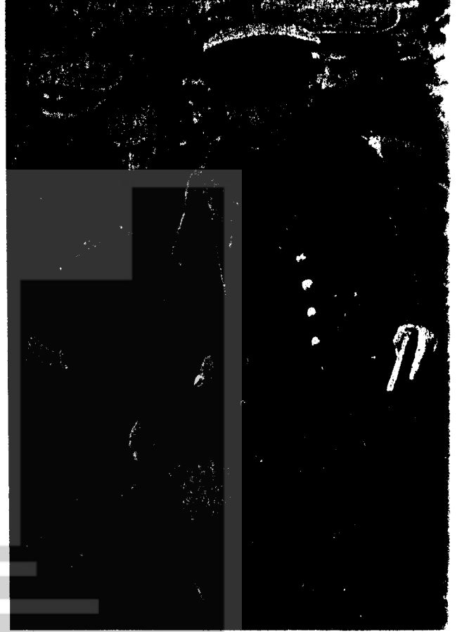
BİR GÜN SİZİNDE YAKANIZA NASIRLI EMEKÇİ ELLERİ YAPIŞTIĞI ZAMAN...

Ülkemizde anti-faşist mücadele özünde bir devrim meselesidir. Fa- şizm rejimin dışından bir yerden gelecek birşey değildir ve yukarı- dan aşağı olarak devlet aygıtı- nın içinde zaten yerleşiktir, ku- rumsal olarak vardır. Bugün söz konusu olan mevcut gizli faşizm- den açık faşizme geçme eğilimle- ridir. Anti-faşist mücadele esas olarak bu faşist kurumları yok etmeden başarılmaz. Anti-faşist mücadele, anti-oligarşik mücade- leye tabidir. Bu sebeplerle mevcut nisbi demokratik şartları koru- mak anti-faşist mücadelede esas alınmaz (talidir). Aksi halde