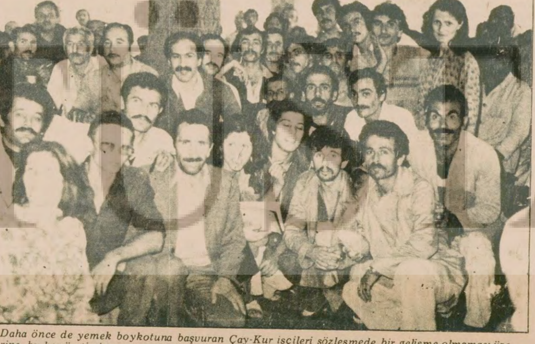
Daha önce de yemek boykotuna başvuran Çay-Kur işçileri sözleşmede bir gelişme olmaması üzerine kez üretimi tamamen durdurdular.

Toplantıda, Milli Halk Meclisi Daimi Komitesinin Yüksek Halk Mahkemesinin ve Yüksek Halk Savcılığının çalışma raporlarıyla ilgili kararlar da onaylandı. Toplantıda ayrıca, Anayasanın değiştirilmesi, Anayasa Değişikliği Komisyonunun kurulması ile ilgili kararlar, 1980-81 yılları milli ekonomi planlarının (Devamı sa.6, sü.1'de)