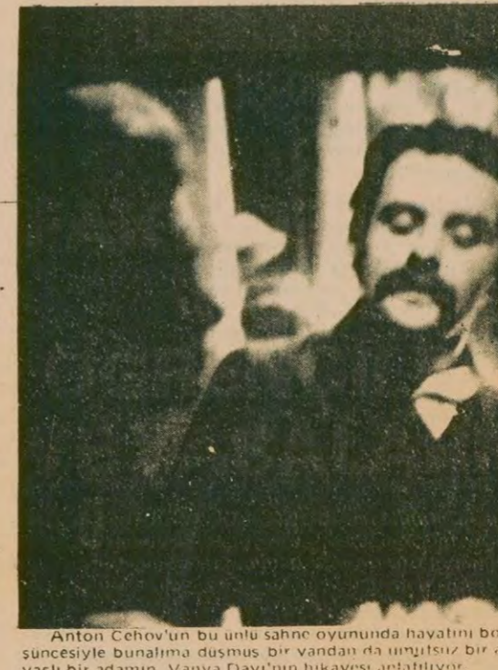
Anton Çehov'un bu ünlü sahne oyununda hayatını bozguna sürdüren bir aileye karşı bir adamın "Vanya Dayı" hikayesi anlatılıyor.