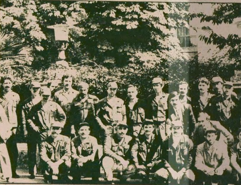
İşçiler "Ortada bu kadar açık bir durum varken yetki meselesinin uzatılmasının ve işyerimizin huzursuz edilmesinin sorumlularını tüm basına ve kamuoyuna şikayet ediyoruz" dediler.

● Demir Dökümdeki yetkili sendika davasına bugün İstanbul 2 Nolu İş Mahkemesinde devam ediliyor