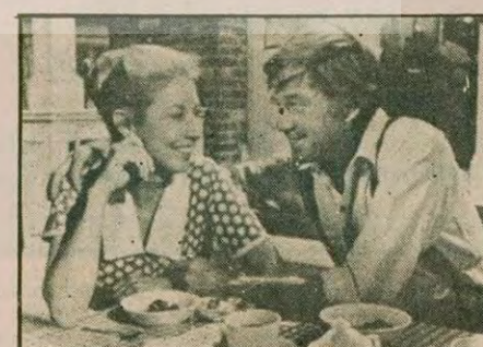
Küçük Ev'in yerine "Walttoon'lar"