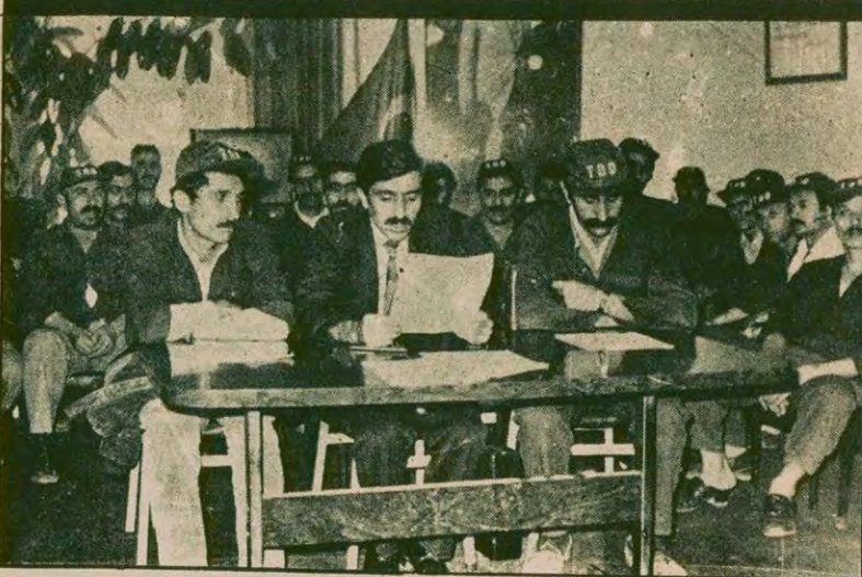
Demir-Döküm işçileri TGS salonundaki basın toplantısına iş elbiseleri ile katıldılar. İşçiler daha sonra topluca fabrikaya döndüler.

● Devrimci Maden-İş üyesi işçiler: "Yüzlerce bilirkişi heyeti de baksa, binlerce mahkeme önüne de gitse sonuç değişmeyecektir. Yetki sendikamızdır"