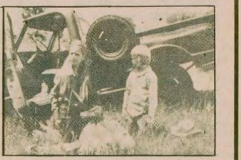
Çocuklar için macera dizisi "Thunder"