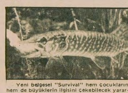
Yeni belgesel "Survival" hem çocukların hem de yetişkinlerin ilgisini çekebilecek yaratılı bir yapımdır.