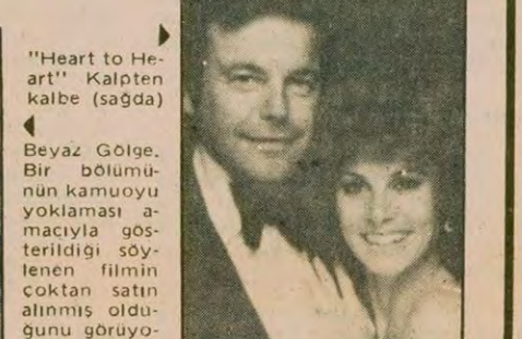
"Heart to Heart" Kalpten kalbe (sağda)