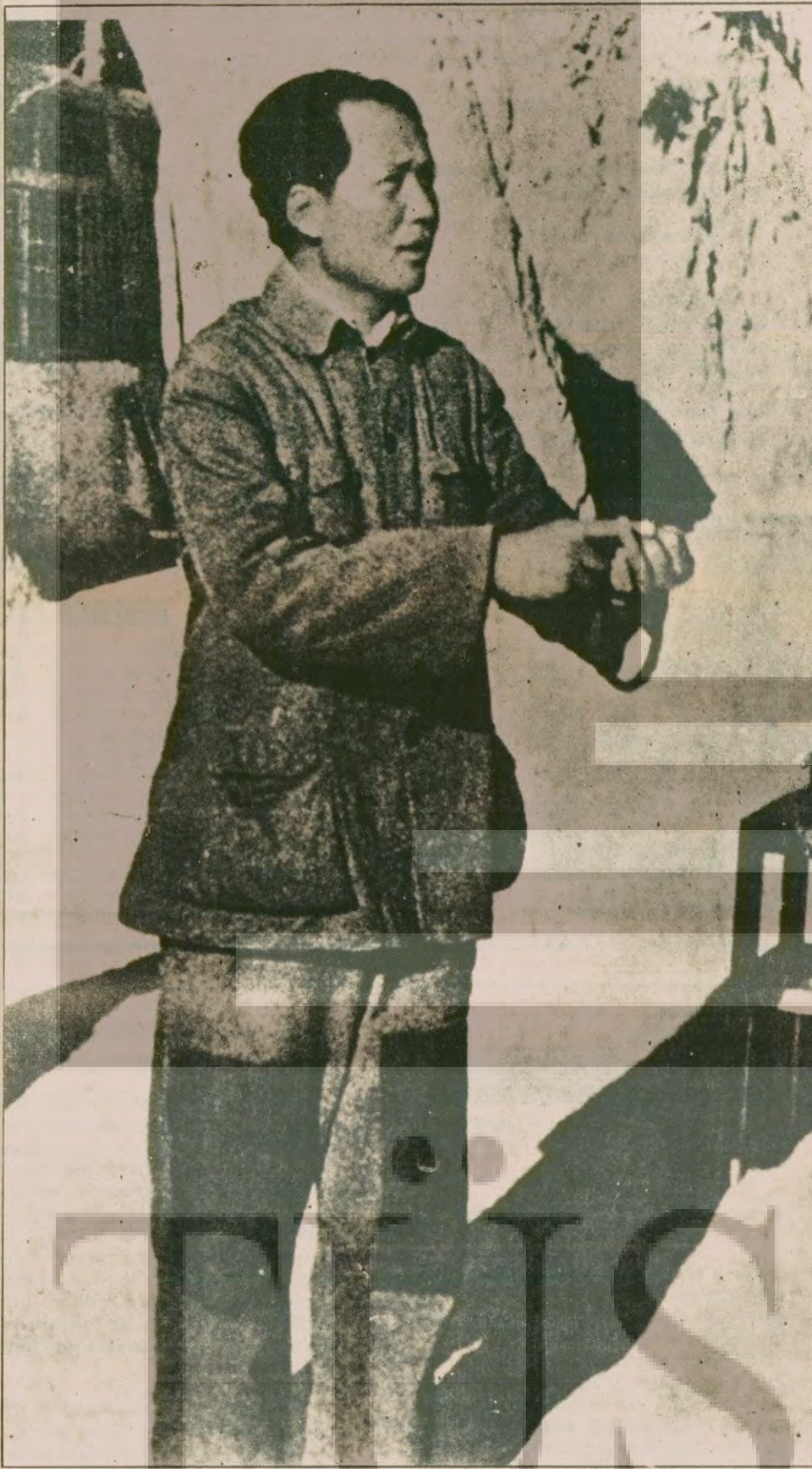
Mao Zedung Yenan günlerinde