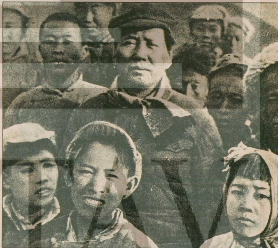
Mao Zedung Yenan'da 1943 Bahar Festivalinde