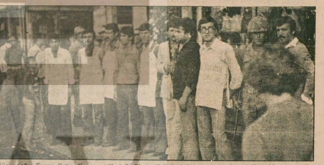
Güneydoğu Tarım Satış Kooperatifleri Birlik işçileri işçi kıyımına ve ekonomik haklarının verilmesine karşı halk grevi başlattılar.