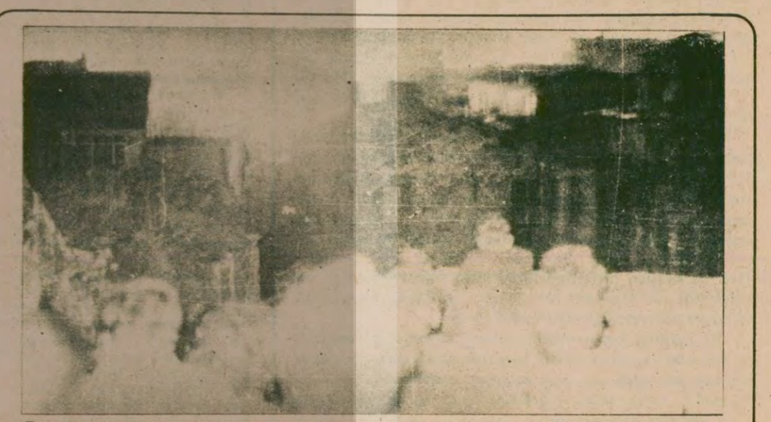
Fener'de üç gün önce kimyevi madde depolarında başlayan yangın, 180'e yakın ailenin evsiz kalmasına yol açmıştı.