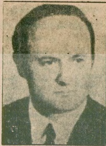
ESAT KIRATLIOĞLU Enerji ve Tabii Kaynaklar Bakanı hakkındaki gensoru önergesini CHP'li Deniz Baykal ve arkadaşları verdi. Gensoru önergesinin gündeme alınması salı günü görüşülecek.