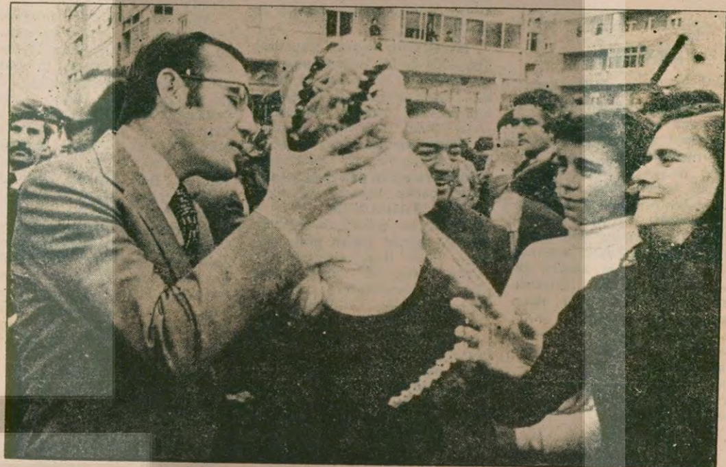
Portekiz Devlet Başkanı Ramalho Eanes

Sonuç olarak Portekiz'de siyasal düğüm aralık ayındaki başkanlık seçimlerinde sonra çözülebilecek. Eğer Eanes yeniden seçilir ve "Demokratik İttifak"ın hükümeti ile çabucak zorunda kalırsa, o zaman Fransızların ünlü deyişi ile "Ya boyun eğecek, ya da istifa edecek!"