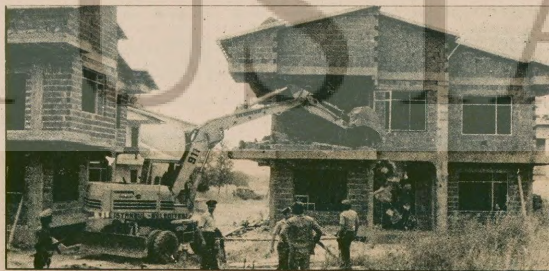
Florya'da kaçak olarak yapılan villalar İstanbul Belediyesince yıktırılırken