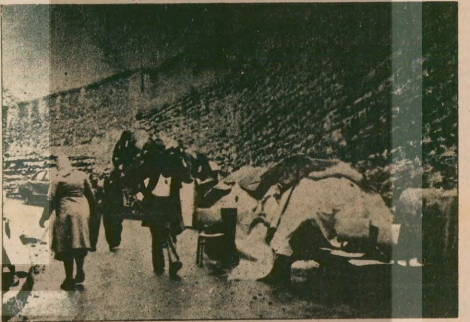
Fener sakinlerinden bazıları eşyalarını sokak ortalarına yığarken bazıları da yangın tehlikesinden uzak akrabalarının evlerine taşındı.

İlk şaşkınlığı geçip de yangının çevreye yayıldığını görenler yangının yakın olduğu evlerden değerli eşyalarını çıkarmaya