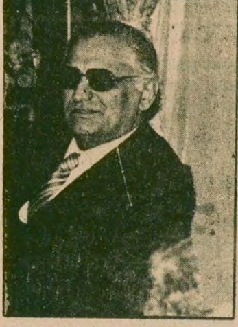
MUSTAFA GÜLCÜGİL Altı hafta kadar önce hakkında gensoru verilen İçişleri Bakanı Mustafa Gülcügil gensoru görüşmelerinden bir gün önce istifa etmek zorunda bırakılmıştı. Gülcügil'in İstanbul'da yaptığı Bakanlıkta ilgili bir basın toplantısından sonra, istifasını Ankara'da Demirel açıklamıştı.