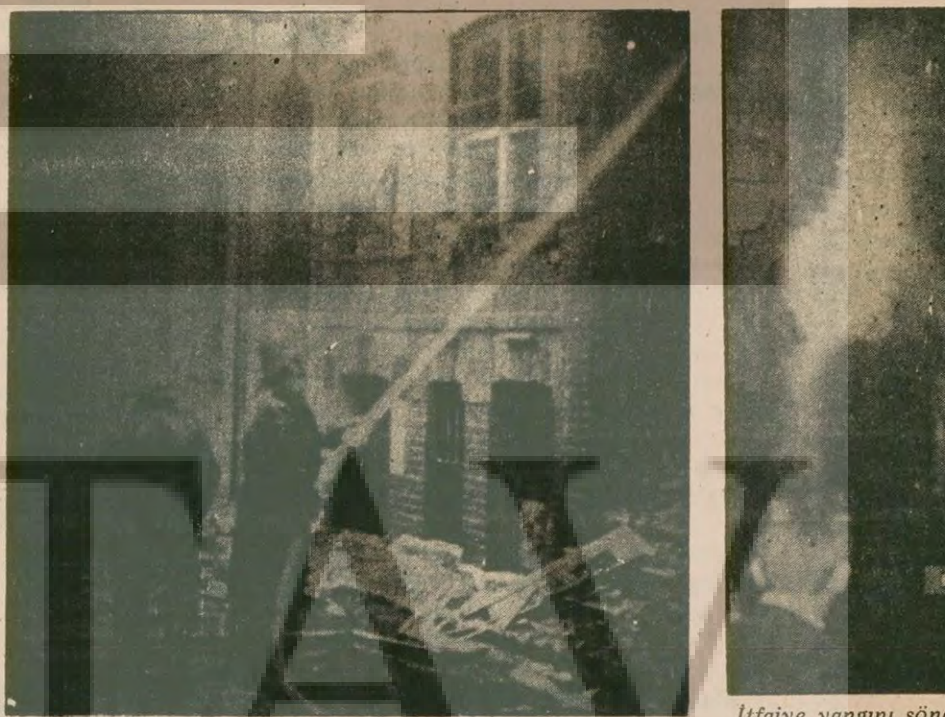
İtfaiye yangını söndürmeye çalışırken gece sokaklara dökülen vatandaşlar, heyecanla yangına, itfaiyeciler arasındaki mücadeleyi izliyor.