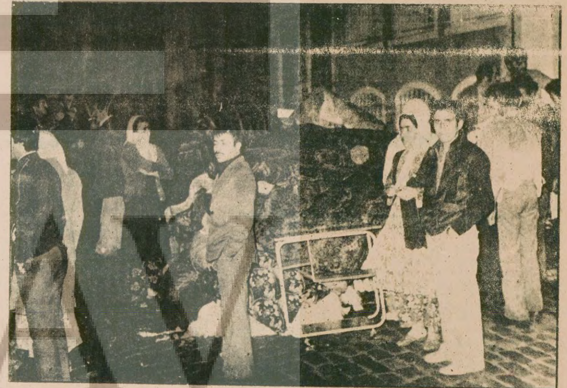
Yangından mallarını korumaya çalışan yurttaşlar, eşyalarını sokak ortasına yığıp başında kaygı ile bekliyorlar.