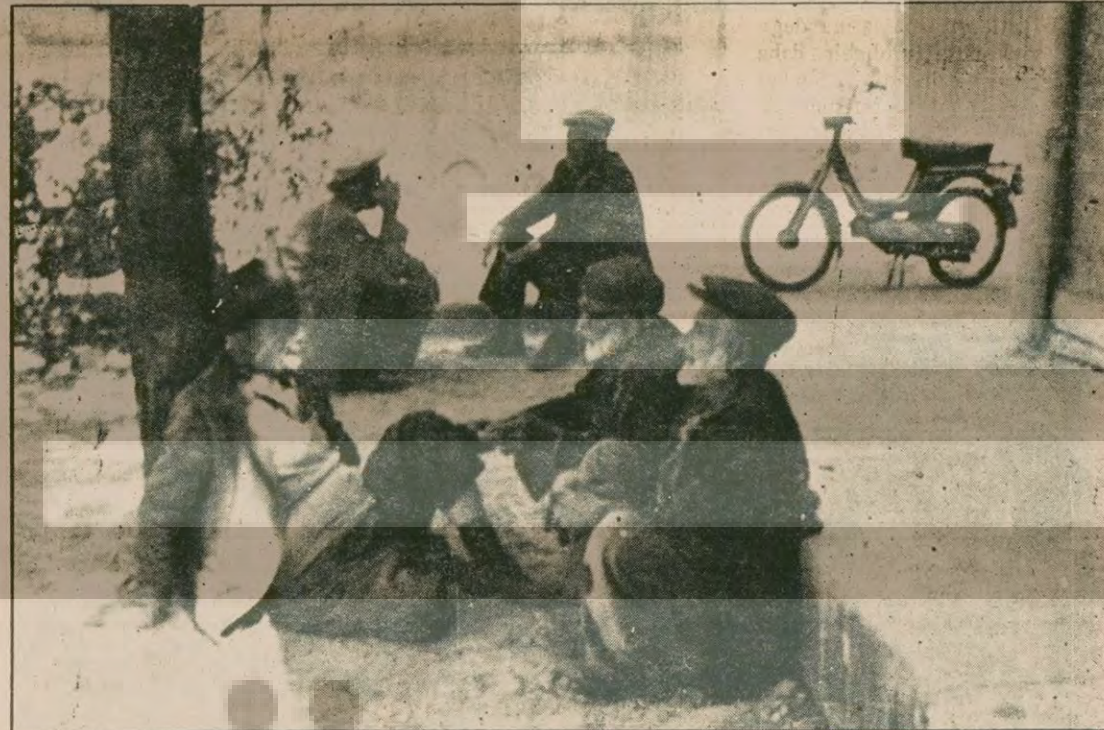
Sudurağı'nda pancar üreticisi köylüler toprak, su pompalarının çalışmadığından, Ziraat Odasının da sorunlarıyla ilgilendiğinden yakınıyorlar.

"Halkın Kurtuluşu olarak esnafa yönelik saldırıların her zaman karşısında olduk ve karşısında olmaya devam edeceğiz. Esnafa yapılan saldırı, halka karşı yapılan bir saldırdır. Halkın bir parçası olan esnafların faşistlikle suçlanmalarını geçmişte olduğu gibi günümüzde de küçük burjuva maceraların bir yöntemi olmuştur."