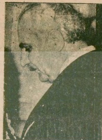
MÜNİF İSLAMOĞLU Sağlık ve Sosyal Yardım Bakanı hakkındaki önerge Sinop Milletvekili Alaattin Şahin ve arkadaşlarının imzalarını taşıyor. Bu önerge de çarşamba günü Millet Meclisinde tartışılacak.