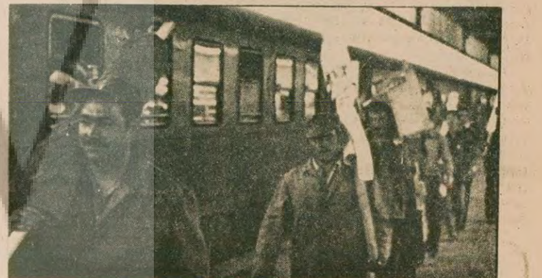
Geçen yıl sürece engelenen "Demir Yol" adlı film, bu yılki yarışmaya katılan filmler arasında.