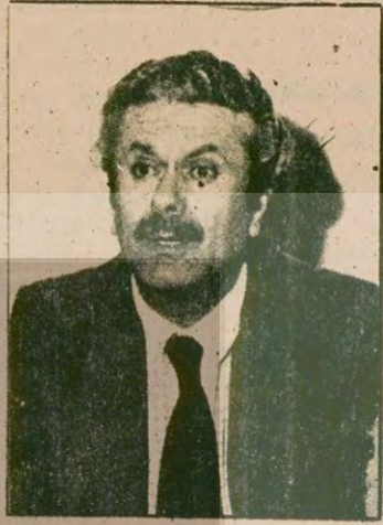
İSMET SEZGİN Maliye Bakanı hakkında CHP Genel Sekreteri Üstündağ ve arkadaşlarının verdiği gensoru önergesinin gündeme alınması tartışılıyor. Gündeme alınması gelecek hafta ortasında görüşülecek ve ardından onun için de güven-sizlik önergesi verilecek.