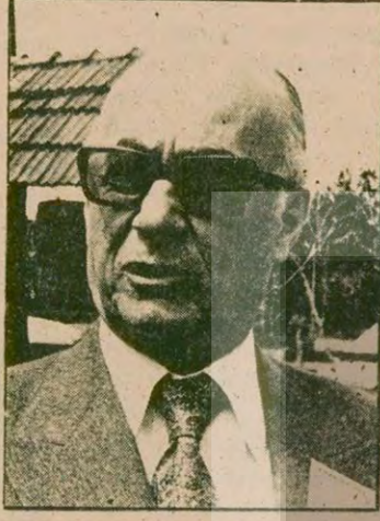
HAYRETTİN ERKMEN Dışişleri Bakanı Erkmen hakkında CHP'nin verdiği gensoru önergesi CHP ve MSP'nin oylarıyla gündeme alındı. Görüşüldü ve güven oylamasının bugün yapılması kararlaştırıldı. Bugün verilecek 226 oy Erkmen'in düşürülmesine yol açacak.