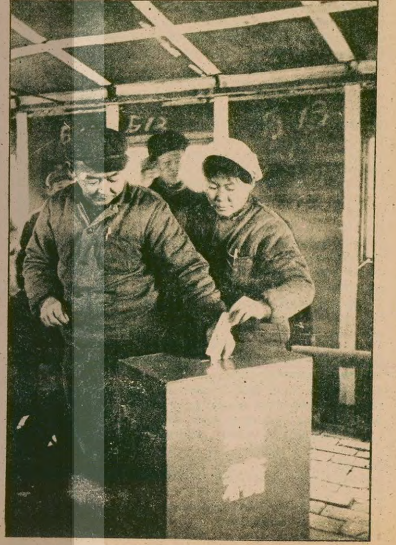
5. Halk Kongresinde delegeler kararları onaylarken.