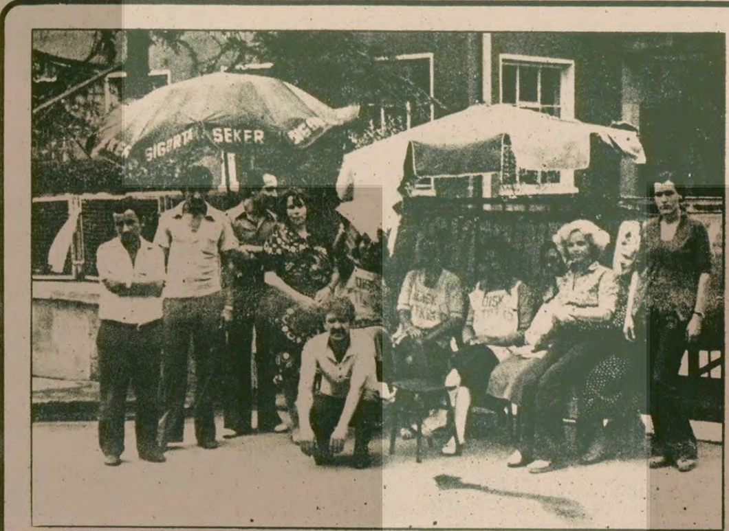
Santa Firma grevçileri soruyor: Bugün 5 bin lira ücretle geçinmek ve çalışmak mümkün mü? İşçiler hakkını alana kadar direnmeye kararlı.

Sovyet basını, grevcilere ve muhaliflere hâlâ saldırıyor