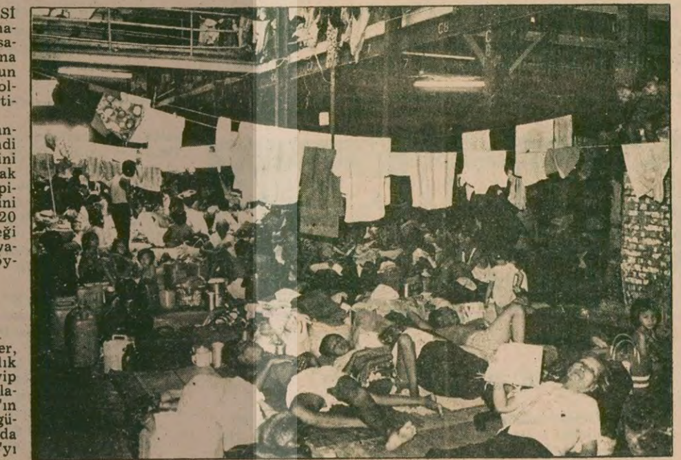
Onbinlerce insan çareyi Vietnam'dan kaçmada buluyorlardı. Açık ve hiçbir güvenliğ olmadığı gemilerde denizlerde sığınacak yer arıyorlardı. Yöneticilere göre bunlar "zararlı" ve "burjuva unsurlar"dı. Ancak yöneticiler şehirlerde her türlü karaborsa ve vurgunculuk yapan, eski rejim zamanındaki imtiyazlarını sürdürenlerin varlığını da dünyanın gözünden gizleyemiyordu.

DIŞ HABERLER SERVİSİ VIETNAM'da sosyal ve ekonomik hayatın gün geçtikçe kötüye gittiği savaşın üzerinden 5 yıl geçmiş olmasına rağmen bu ülkedeki ekonomik durumun savaş yıllarındakinden daha kötü olduğu, hatta daha da kötüye gittiği belirtiliyor.