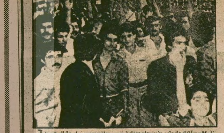
İstanbul'da da memurlar yan ödemelerinin yüzde 60'ını Maliye Bakanına postalandı. Fotoğraf: memurlar Büyük Postane önünde havalere yatarak için beklerken. Fotoğraf:Metin AKTAS