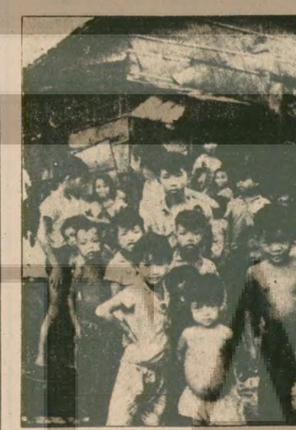
Vietnam'da bir balıkçı mahallesi ve çocukları... Durumlarında eskisine göre bir değişime yok.

VIETNAM'ın boyuna bakmadan Sovyetlerin desteğiyle giriştiği hegemonyacılık sadece ekonomik hayatı buhran içine sokmakla kalmıyor aynı zamanda kuzey-güney arasında da şiddetli çekişmeler yaratıyor. Kuzeyliler, güneye ortak girişimlerin ülke sorunlarını daha da kötüye götüreceğini ileri sürerken güneyliler de kuzeylilerden şikayet ediyorlar. Savaş öncesi toprak edinme isteği taşıyan çoğunluğu çiftçi çok sayıda aile tarım alanındaki buhranı görünce şehirlerdeki lüks hayata özeniyor ve buralara göç ediyor. Bunun sonu cu birçok yerde tarım alanları çöle dönmüş durumda.