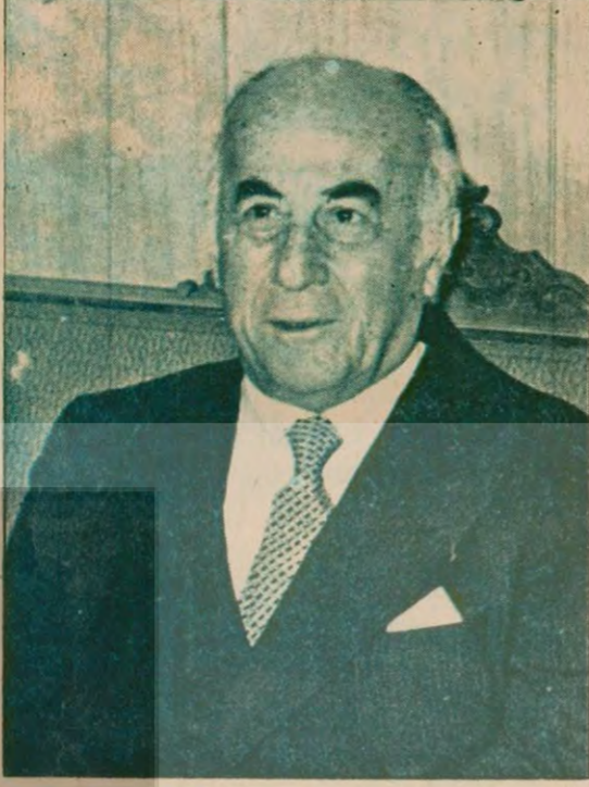
Dışişleri Bakanı Hayrettin Erkmen

● ERKEN SEÇİMİ GÖRÜŞEN ANAYASA KOMİSYONU, BU DEFA DA MESELEYİ SENATO KOMİSYONUNA HAVALE ETTİ.