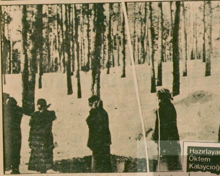
1 Eylül 1939'da Polonya'ya saldıran Naziler, Varşova'yı işgal ettiler. Bu sırada sayısız Polonyalı katledildi. Ama Hitler'e karşı ilk direniş de Polonya'da başladı.