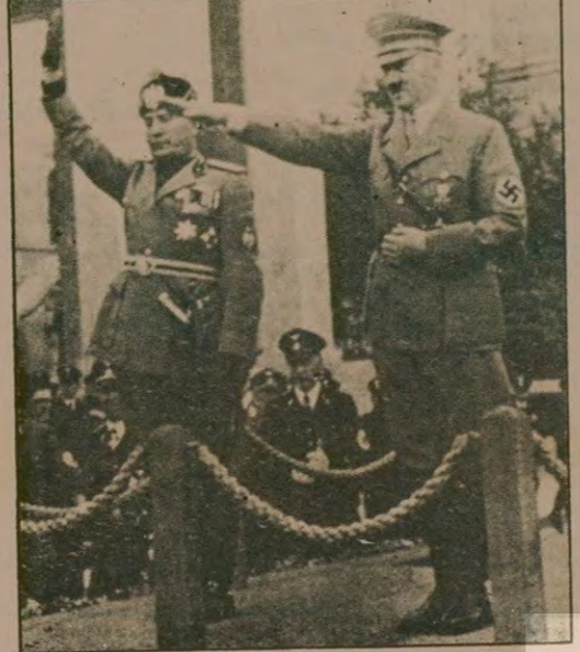
İkinci Dünya Savaşında faşist kampın iki ünlü üyesi, Mussolini ve Hitler. İkisinin de akıbeti aynı oldu. Mussolini başlangıçta Hitler'e muhaliflet ediyordu. Ancak Avrupa'da "yatıştırıcılık" hakim olup da Hitler ipleri eline geçince Mussolini'yi de yanına çekiyordu.

1930'lar dünyasında en geniş sömürge ve nüfus alanlarına sahip ülkeler İngiltere ve Fransa'ydı. Ama dünya halklarına en büyük tehdidi bunlar yöneltiliyordu. Çünkü bu "ihlali" emperyalistler mevcut durumun korunmasından yanayken, dünyayı bir savaşla yeniden emperyalist paylaşım konusu