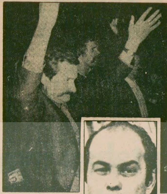
Walesa grev zaferini açıklıyor. Yanda Jacek Kuron.

Ecevit, üniversitelerin yürürlükteki 1750 sayılı yasasını verdiği yetkiye dayanarak yeni tasarı hazırlığı yapabileceğini belirterek, CHP'nin bu konuda yardımcı olabileceğini söyledi.