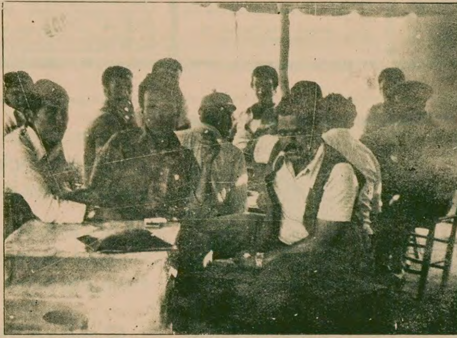
Kozanlı köylüleri de, "Emanete hiyanetlik yapıyorlar. Basa geçen hükümet Tarış'te hiyanetlik yapıyor. Hükümetin ilan ettiği taban fiyat geçen yılın piyasası. Aldığımız pahali, sattığımız ucuz" diyorlar.

Sonuçta, sosyal-emperyalist tahakküm için revizyonist diktatörlüğün siyasi ve ekonomik baskılarıyla binlerce Polonya halkının başına bela olmuştur. İşte mücadelede bu zorba sisteme karşıdır. Efendisinin dizi dibinden ayrılmayan Gierk ve kliline önünde eğilmek zorunda kaldığı bu devrimci dalga emperyalist Rusya'nın candamarına uzanmıştır bir kere... İşçiler kendi deyimleriyle "Eski bozuk düzenin yerine yeni bir bozuk düzen" getirmek için değil, sosyal-emperyalist zinciri kırmak için bayrağı kaldırmışlardır. Bayrağın öteki Doğu Avrupa ülkelerinin göklerinde dalgalanması için çok beklemek gerekemeyecektir.