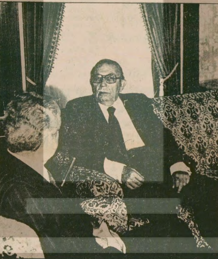
Cumhurbaşkanı Vekili Çağlaya ngil, İstanbul Valisi Nevzat Ayaz la.