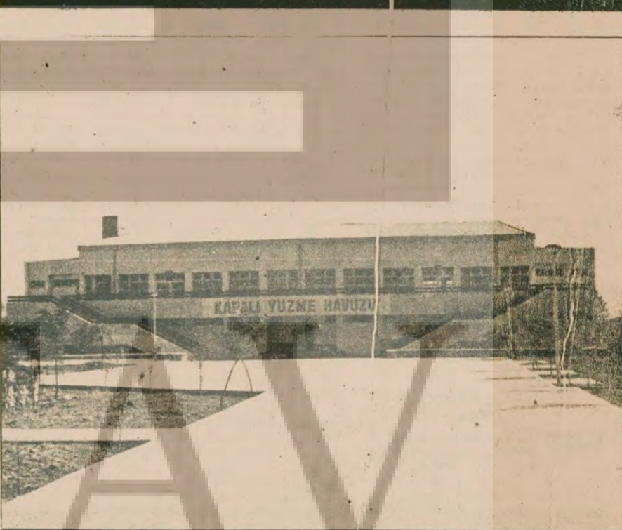
Fotoğrafta 2 yıl önce törenle hizmete girmesine rağmen proje aksaklıkları giderilemeyen Kahramanmaraş Kapalı Yüzme Havuzu görülüyor.