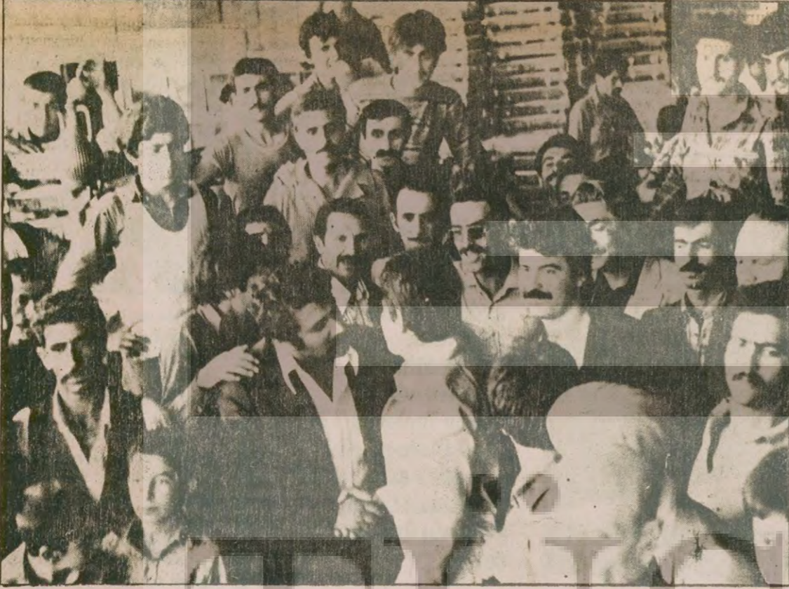
Niğdeli hamalların ve Siirtli hamalların temsilcileri öpüşerek barıştıklarını açıklıyorlar. böylece İstanbul Halinde bir haftadır süren gerginlik TİKP'nin çabasıyla sona erdi