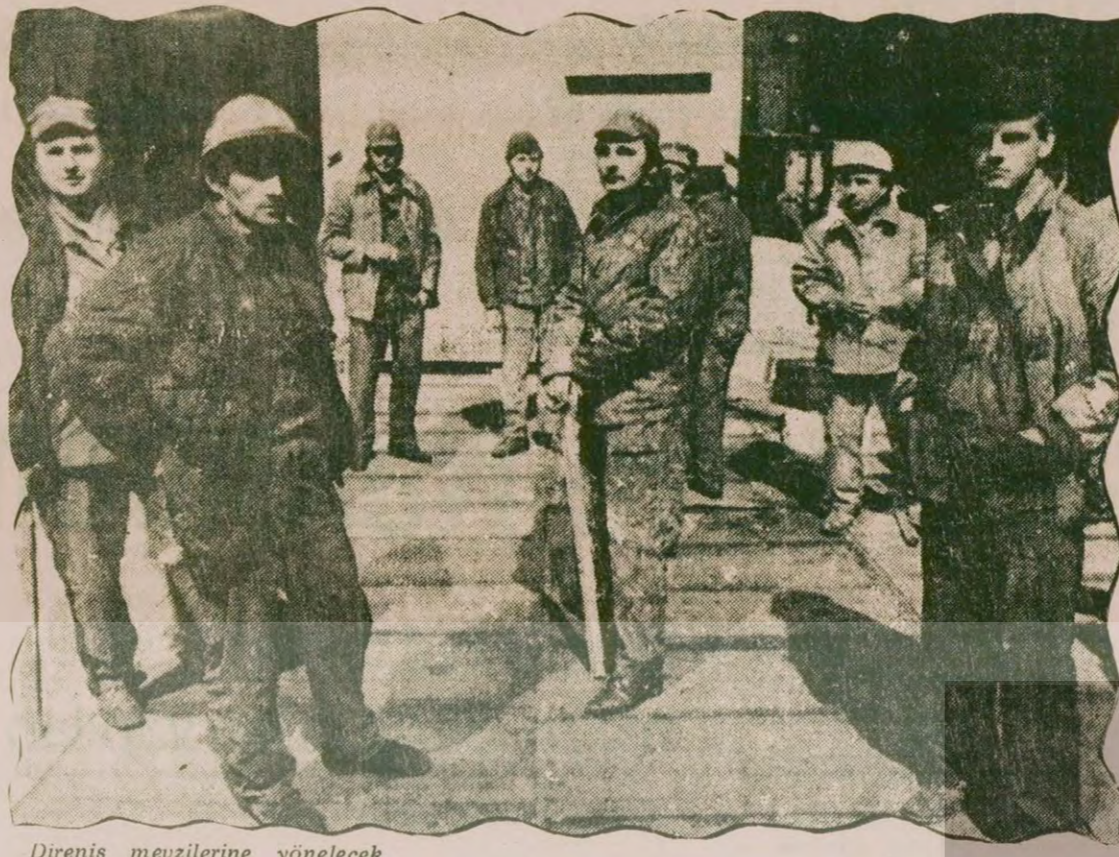
Direniş mevzilerine yönelecek saldırıya karşı uyanık bekleyen tersane işçileri, Polonya işçisi, tutuklanan önderlerinin serbest bırakılmasını istiyor.

Ote yandan Anadolu Ajansı (Devamı S. 6 Sü. 1'de)