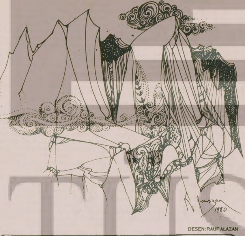
DESİN: RAUF ALAZAN

Bu il Aydın ilidir. Bu il bizim ilimizdir. Bizim dağlarımızdır bu dağlar. Ve toprağı doğurta ve şekil veren demire Atçalım bir ırgat. Dedemizin dedesinin dedesi, bir garip bir yiğit kişi. Tarih kitaplarında geçmez adı. pamuğa atefe bizziz. Küçücük bir kedi büyüdüyellerimizde. Büyük Menderes Küçük Menderes ve Gediz. Ve türkülerini yakan yaranan bizziz. Biz halkız. DEVAM EDECEK