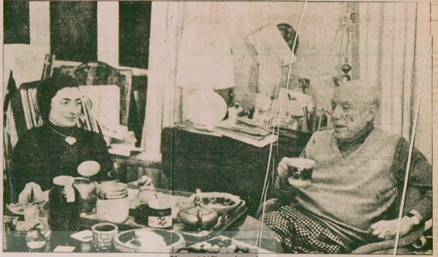
70 yaşındaki Picasso harisıyla

"Değişen Tiyatro" nun en büyük kusuru, kamunızca, üniversite yayınlarından olması. Çünkü, ilk yazımızda da değinmiş olduğumuz gibi, üniversitelerin bastığı yapıtlar herhangi bir kitabevinde bulup almak hemen hemen olanaksızdır; ilgili kurumlardan getirtmekse, apayrı bir derittir.