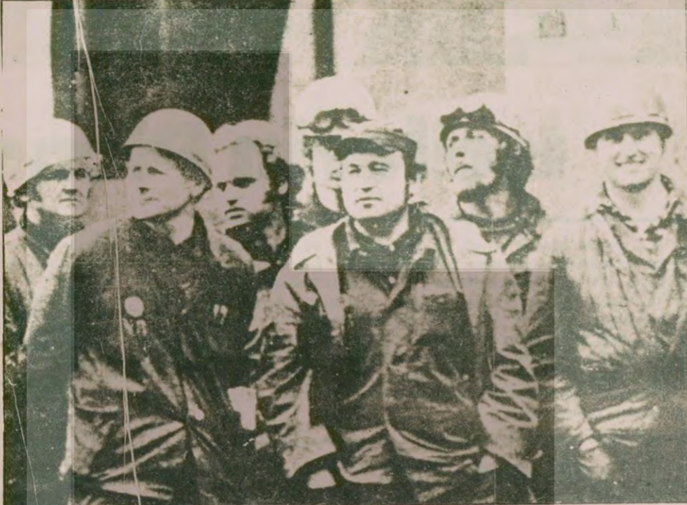
"Ülkedeki politik ve ekonomik durum hakkında tam ve doğru haber talep ediyoruz"

GDANSK GREVCİLERİ GIEREKİ NASIL TERLETTİ? (9 saatlik toplantının ses bantları)