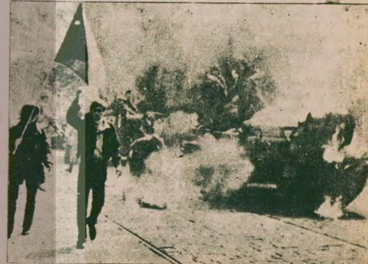
1968 Ağustosunda Rus tanklarına direnen Çek yurtseverleri

•Çek Sosyalist Muhalefeti yayın organı: "Çekoslavakya halkının mücadelesi bağımsızlık ve demokrasi gerçekleşene kadar sürecektir"