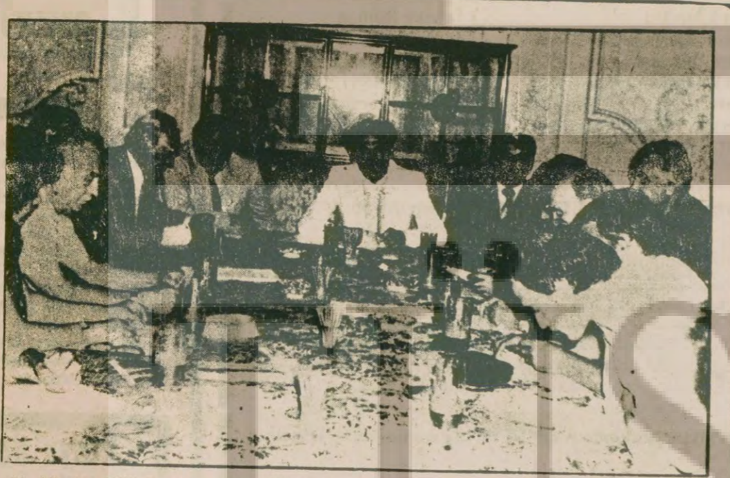
23 Ağustos Millî Bayramının 36. yıldönümü nedeniyle İstanbul'daki Romanya Başkonsolosluğunda yapılan basın toplantısı.