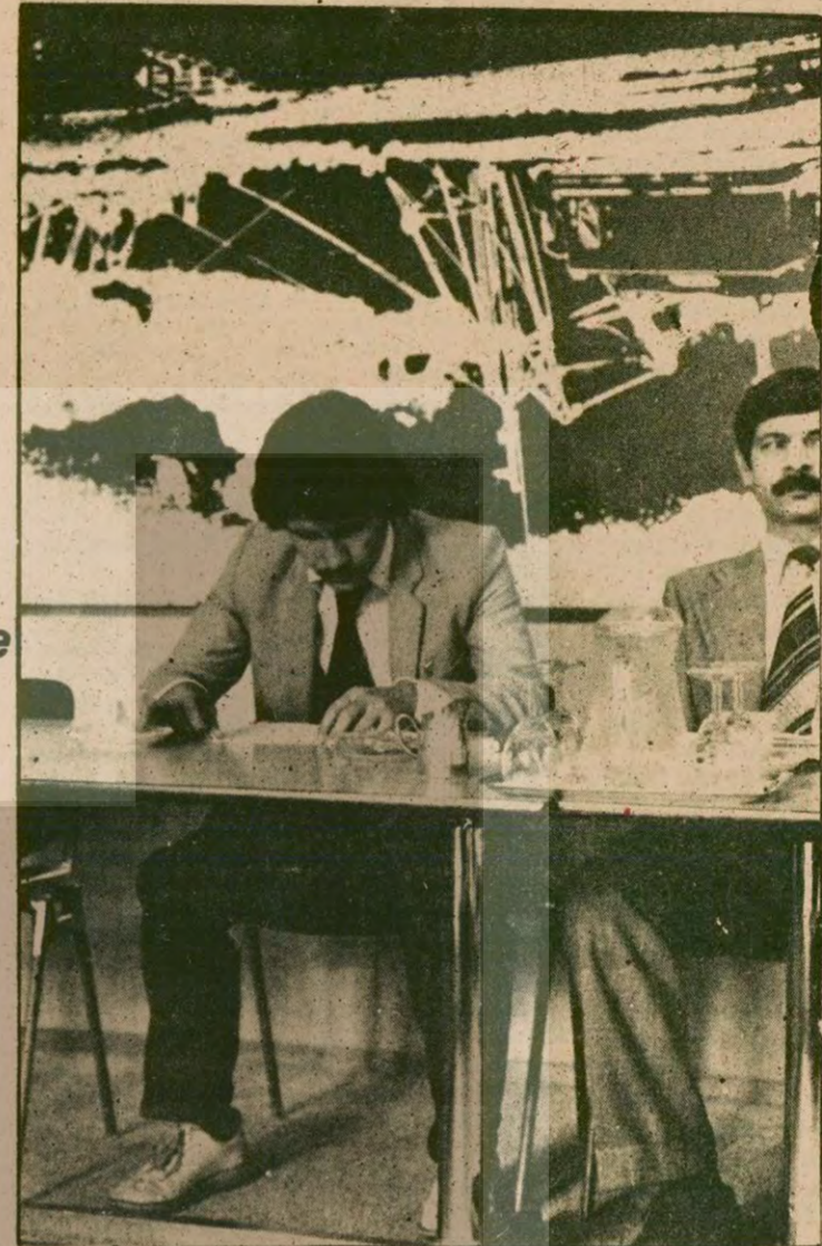
"Yaptıklarımı nasıl başım dik anlatabilirim?"

«Size MHP'nin karanlık işlerini anlatacağım. Sizden benim gibi MHP'nin eline düşen gençlere yardımınızı rica ediyorum. Onları kurtarın!»