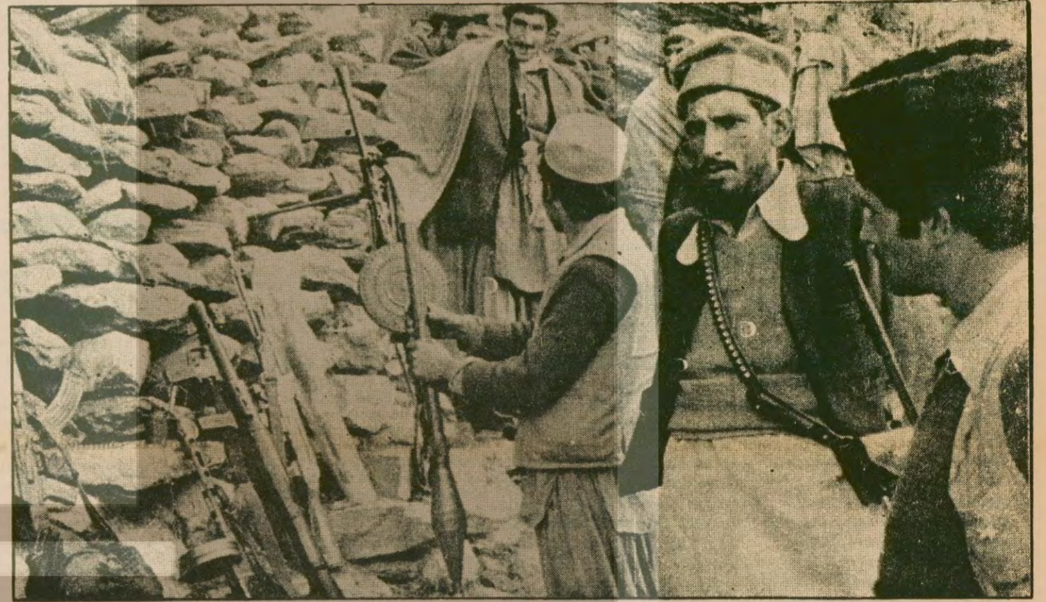
İşte Herat kentini kuşaltmaya hazırlanan Afgan direnişçileri.