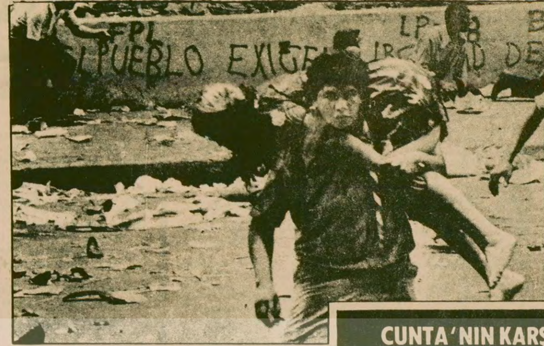
El Salvador'da artık olağan hale gelen manzaralardan biri. Bir çatışma sonrasında tedhişçilik kurbanlarını taşıyanlar.