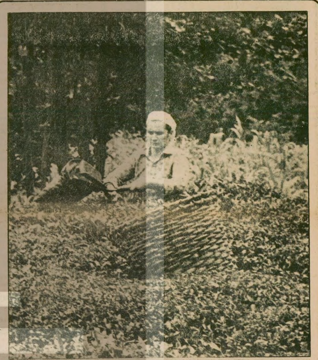
Türkiye'de çalışan kadınların yüzde 90'ı ziraat, ormanlık, avcılık, balıkçılık ve genel hizmetlerle uğraşıyor.