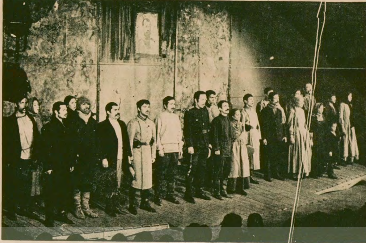
Brecht'in Gorki'den uyarladığı "Ana" adlı oyun 1974'de AST tarafından da sahnelenmişti.

Elbette, tartışılabilir pek çok yanı var; ama bunu bir kusur olarak görmeliyiz. Devrimci işçi örgütleri ve sınıf kavgasını sanatsal eylem planına çıkarmak isteyen emekçilerin çok yararı bir kitap olduğu inancındayız. Birtakım tarihsel gerçekleri yansıtmaya da ayrı-