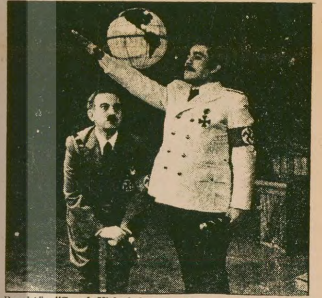
Brecht'in "Şeyh Hitler'e karşı" adlı oyunundan bir sahne.