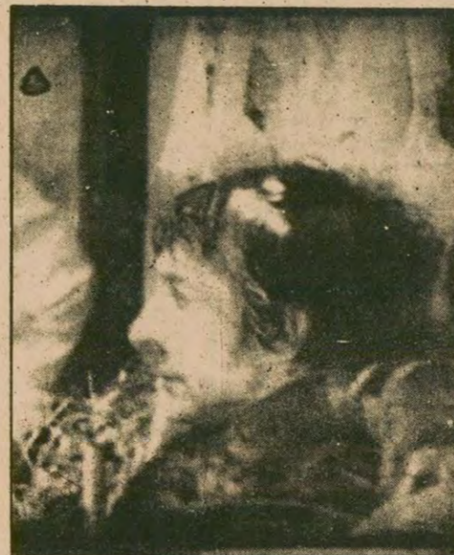
Kral Lear Shakespeare'in büyük trajedilerinden biridir.

Ülkesini üç kızı arasında pay etmeye karar veren Kral Lear kızlarına kendisini ne kadar sevdiğini sorar. Büyük kızı Coneril ile ortanca kızı Regan babalarını çok sevdiğini övgü dolu sözlerle anlatırlar. Küçük kızı Cordelia ise babasını sevmesi gerektiği kadar sevdiğini söyler. Küçük kızın bu ifadesine kızın Regan, ülkeyi büyük ve ortanca kızları arasında bölüştürür, Cordelia'yı da evlathktan reddeder. Tüm yetkilerini ve ülkesini iki kızına devreden Kral Lear, emrindeki yüz ath ile birlikte önce büyük kızı Coneril'de, daha sonra ise Regan'da kalacaktır. Ancak kızları babalarını aşağılar ve emrindeki yüz askeri de kabul etmezler. İhtiyarladığını ve bunaldığını söyleyerek hareket ederler.