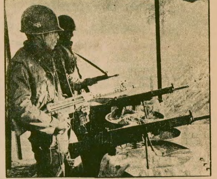
İşte hükümetin tam olarak denetleyemediği ordu birliklerine bağlı 2 asker.