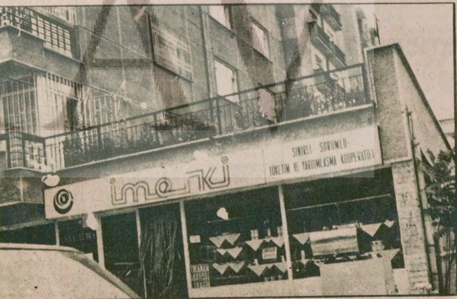
Ülkü Ocakları tarafından para sağlamak amacıyla kurulan yerlerden biri: İmeski Kooperatifi

● Ülkü Ocakları hesabına kiraathaneler, bilardo salonları açıldı