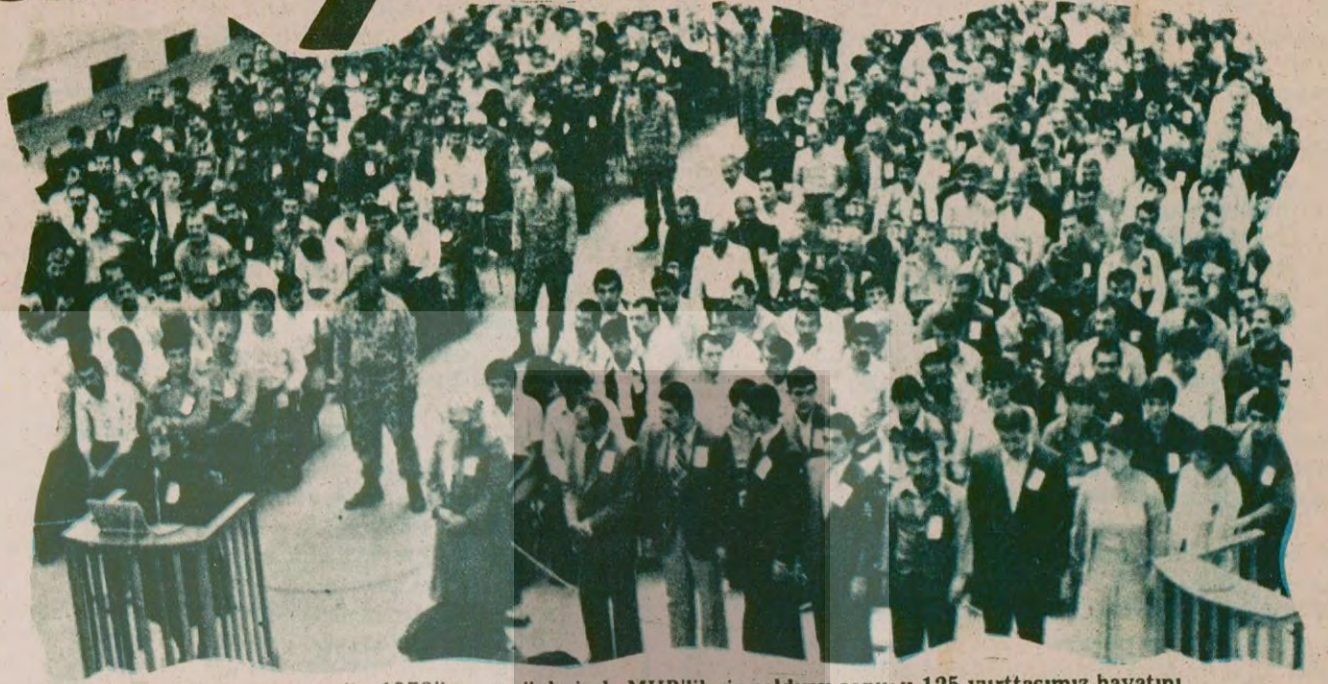
Kahramanmaraş'ta 1978'in son günlerinde MHP'lilerin saldırısı sonucu 125 yurttaşımız hayatını kaybetmişti. Daha sonra açılan davada katliama katılan sanıklar yargılandı. Ve sonuçta katliamda elinde silah olan ve bıçakla köylüsüne saldıranlardan 22'si idama mahkum oldu. 22 idam, 13 müebbetle sonuçlanan bu dava İstiklal Mahkemelerinden bu yana ilk defa bu kadar çok idam kararını içermektedir.

● İdam ve müebbet mahkum olan sanıkların paniğe kapıldıkları görüldü