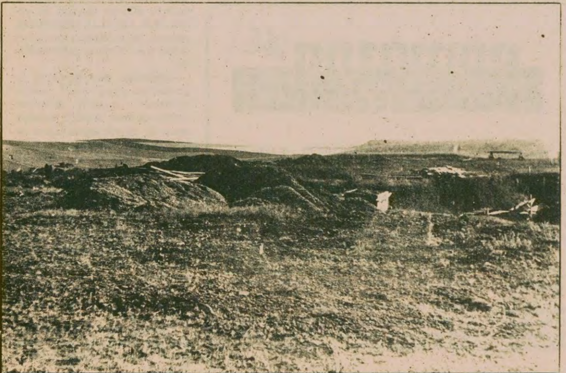
CHP Yavruturna delegesi Raif Erdem'in mavi bere tiler tarafından vurulduğu yer.