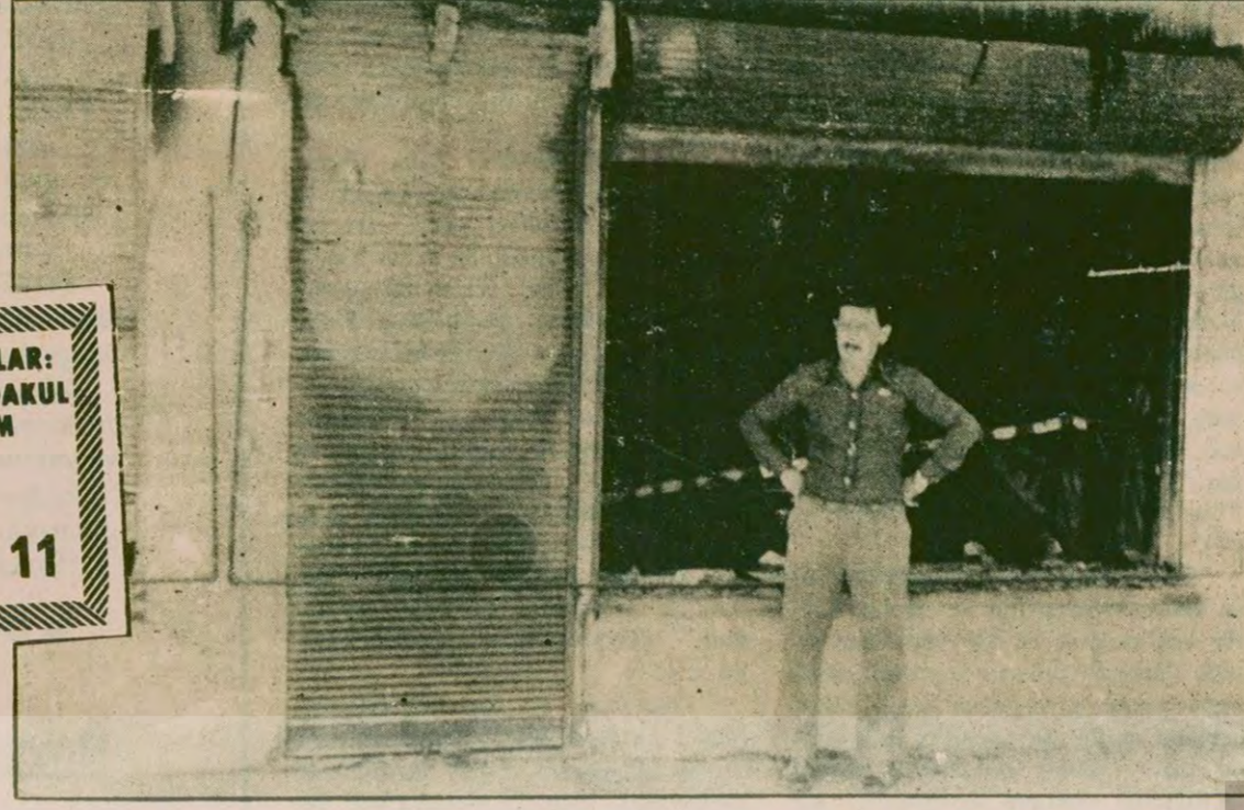
Kurtuluş Savaşı Gazisinin oğlu, yakılan dükkanının önünde.