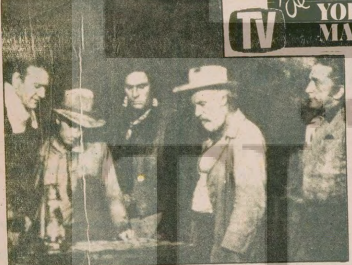
Geçtiğimiz yıl hayata gözlerini kapayan John Wayne gerçek hayatında da tam bir kovboydu.

Yönetmen: John Ford Oyuncular: John Wayne, Maureen O'Hara Yapım Yılı: 1950