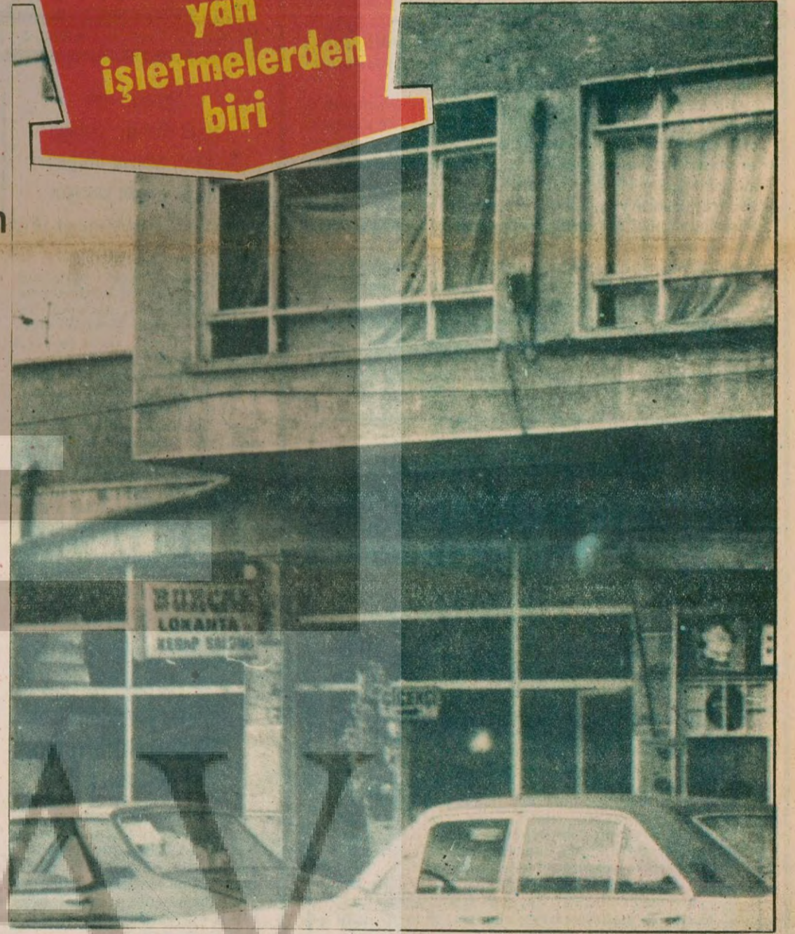
ÜGD'NİN KURDUĞU BURÇAK LOKANTASI

Cebeci Sinemasının karşısında ÜGD tarafından kurulan Burçak Lokantası aracılığıyla, cezaevindeki komandoların ayda 300-400 bin TL tutan yemek ihtiyacı karşılanmaktadır.