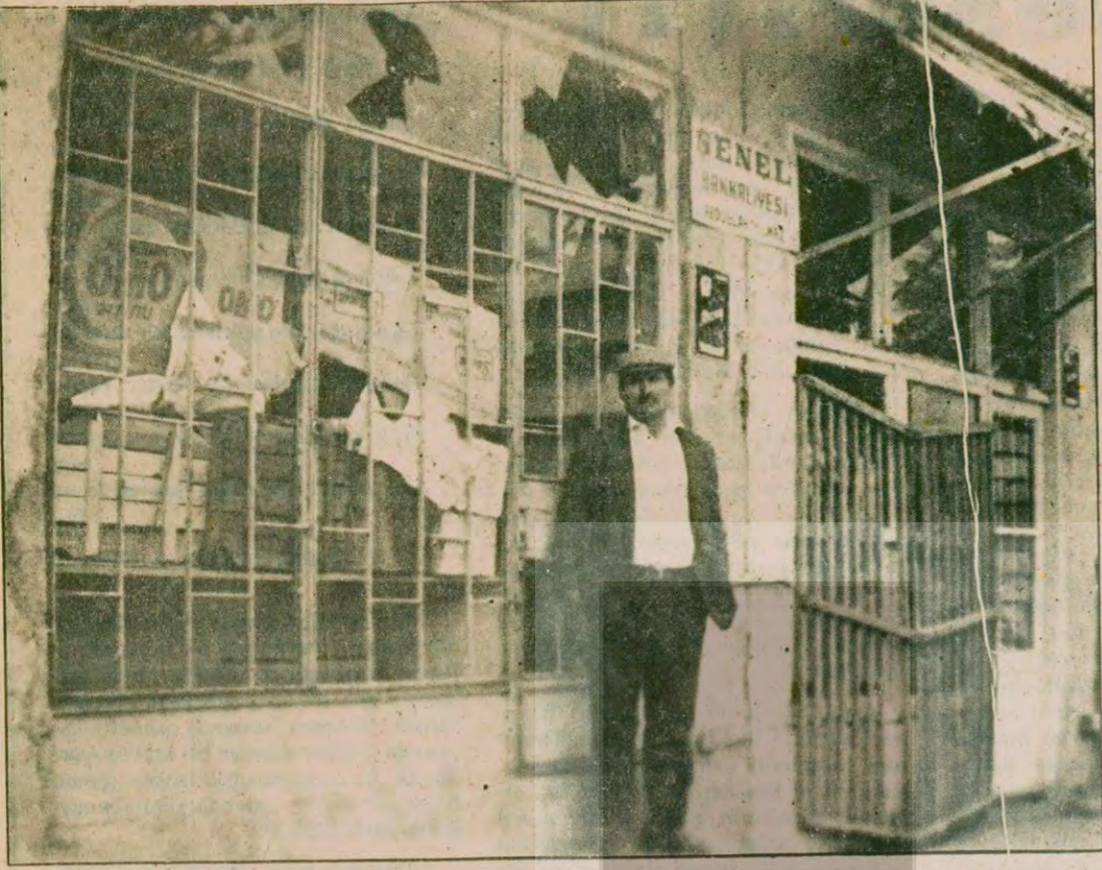
Dükkanı yağma edilen bir vatandaş