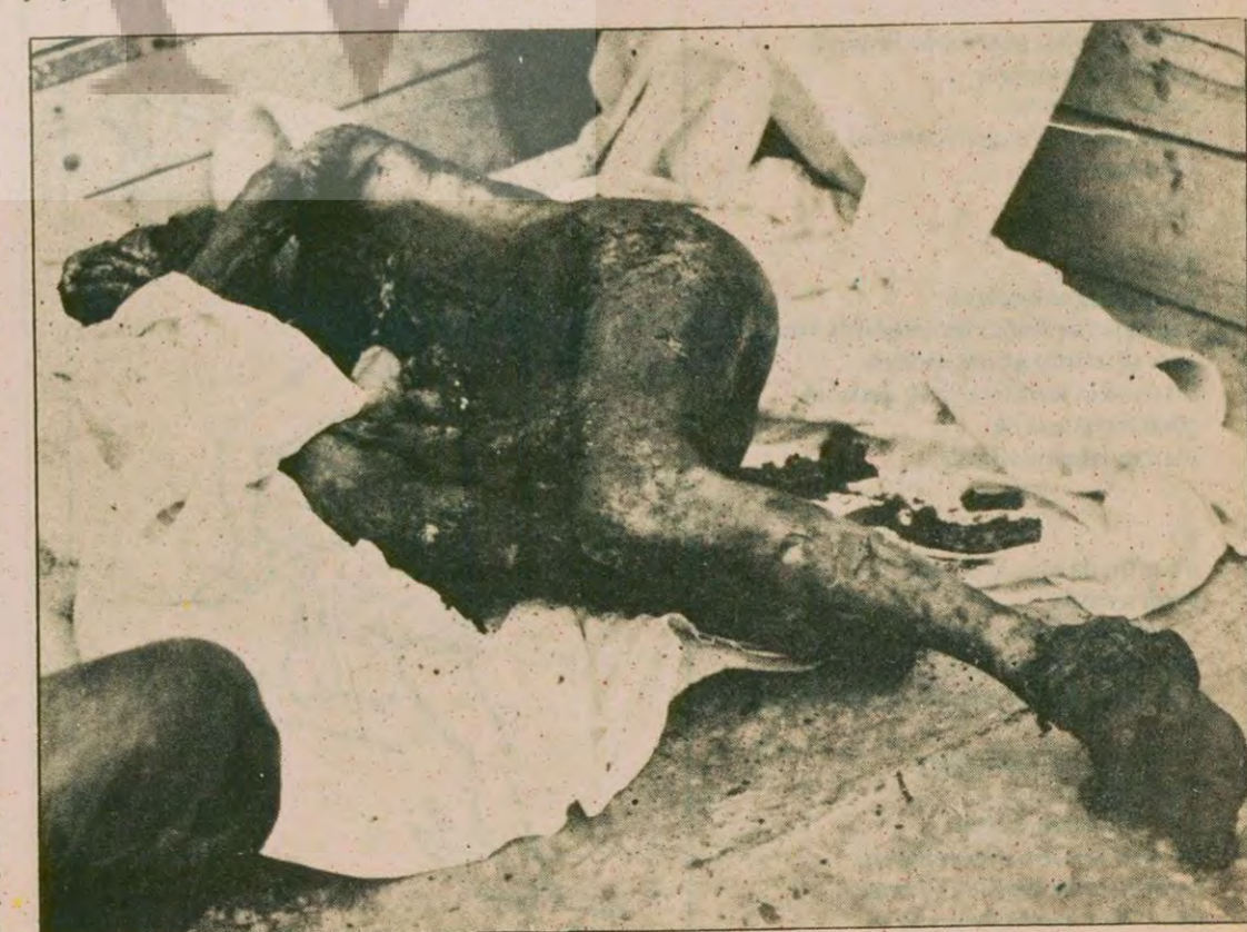
Çorum'da MHP'nin katlettiği insanlardan biri daha. Öldürülmekle kalmamış, bu gözü caniler bir de cesedini ateşe vermişler.