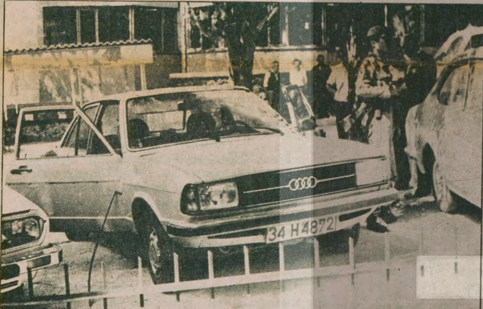
Kemal Türkler arabasını daha park yerinden çıkarmadan yaklaşan iki terörist, çok yakın mesafeden kurşunlarını boşalttılar.