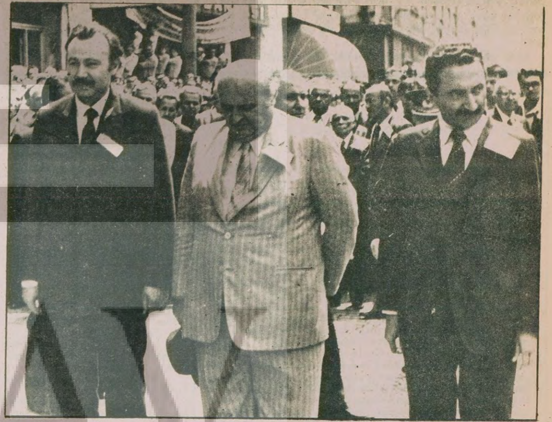
Demirel ve Ecevit, eski Başbakanlardan Nihat Erim'in cenaze töreninde.

Terör odaklarına karşı ne zaman birlikte yürüyecekler?