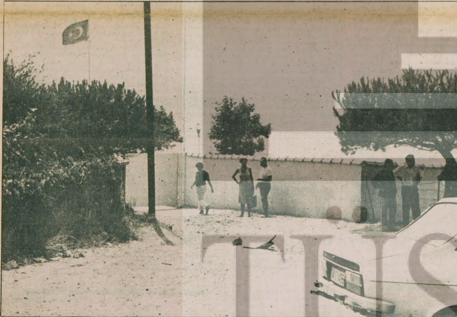
Tam plajın önünde vurdular

Erim'in hayatta kalan koruma polisi anlatıyor