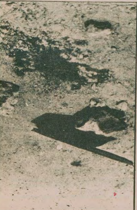
Nihat Erim'in öldürüldüğü yerde kan lekeleri... Kan gölünü her gün büyüyenler ülkeyi iç savaşa sürüklemek istiyor.

HABER MERKEZİ 12 Mart dönemi Başbakanlarından Nihat Erim'in silahlı katillerce öldürülmesi çeşitli çevrelerde büyük tepki yarattı. Olaydan sonra bir açıklama yapan Cumhurbaşkanı Vekili İhsan Sabri Çağlayangil, "Birliğe tarihin hiç bir döneminde bu kadar çok ihtiyaç duymadık" dedi. Çağlayangil'in açıklaması şöyle: (Devamı sa. 6, s. 5'te)