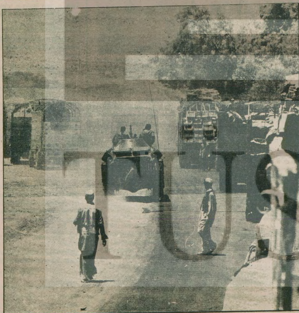
Kabil-Celalab'da yolunda Rus askeri konvoyu. Moskova'dan uçakla gelen tam teçhizatı işgal birlikleri, başkentten güneye doğru yayılıyor.

Çin hükümeti geçen ay içinde verdiği bir başka protesto notasında da Vietnam'ın Tayland'a giriştiği askeri operasyonu "tehlikeli sonuçlar doğurabilecek bir macera olarak" değerlendirdi, ancak hangi karşı eylemlere başvuracağı konusunda açıklık getirmedi.