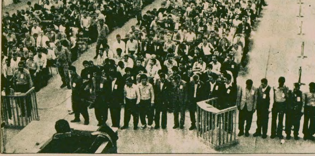
Maraş katliamı ile ilgili davanın savunma aşaması başladı. Davada savunma yapan müdahil avukatlar, olayların MHP tarafından yönlendirildiğinin, yürürlüğüne ilişkin çeşitli kanıtları ortaya çıkarttı. Olay sırasında bağırılan sloganların, taşınan üç hilali MHP bayraklarının her birinin bu sonucu doğrulayan birer delil olduğunu açıkladılar.