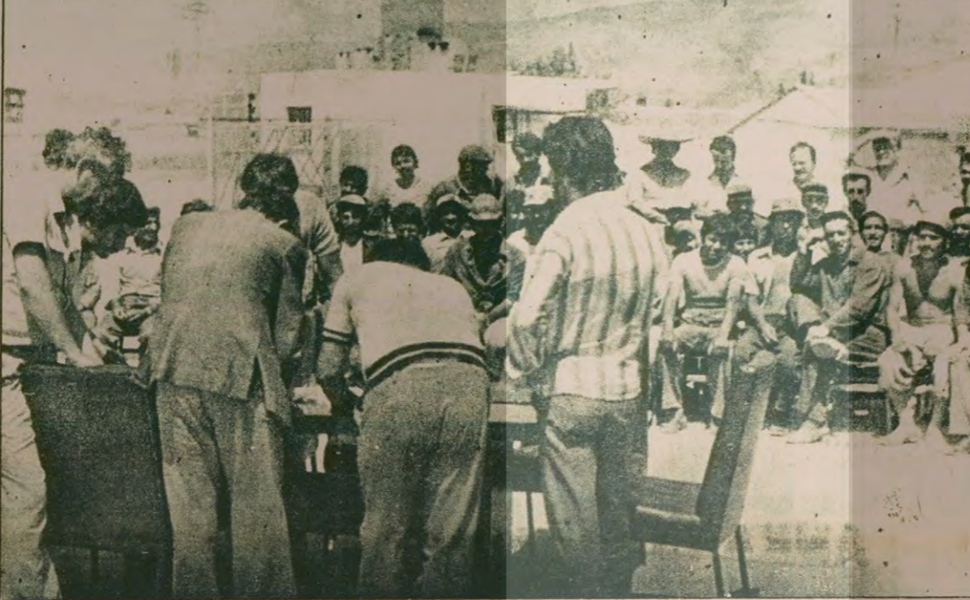
İzmir'de Tekel Sigara Fabrikası inşaatında çalışan işçiler Devrimci Yapı-İş Sendikasının müteahhit firma ile imzaladığı toplu sözleşme ile çeşitli haklar sağladılar. Resimde işçiler toplu sözleşmenin imza töreni sırasında

Panelde ayrıca bakanlıkla ilgili partizanlık belgeleri de basına gösterildi. Sürgüne uğrayan Fevzi Arıcı'nın Kastamonu AP heyeti ve Muğla AP II Başkanı tarafından önerildiği belirtildi.