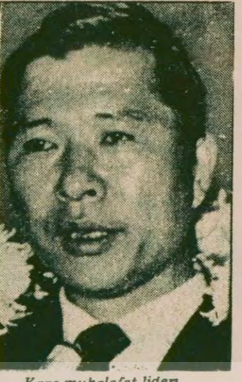
Kore muhalefet lideri Kim Dae Jung

Willy Brandt «Güney Kore muhalefet liderinin durumundan kaygılıyım»