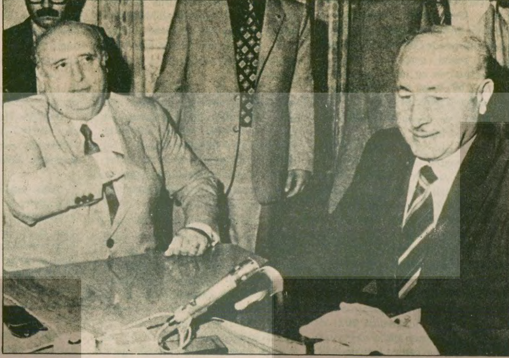
MSP Genel Başkanı Necmettin Erbakan ile Başbakan ve AP Genel Başkanı Süleyman Demirel arasında dün beş saat süren görüşme sonunda, Demirel, Erbakan'a hayır dedi. MSP'nin bundan sonraki kararı ise hükümetin geleceğini belirleyici hale geldi.

«Milletimizin inleyen sesine kulak vermememiz mümkün değildir... Başkanlık Divanında görüşerek tutumumuzu açıklayacağız»