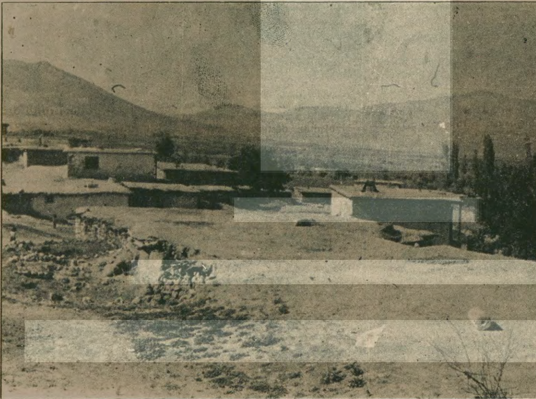
Çömlekoba köyü ve susuz kalan araziden bir görünüş.