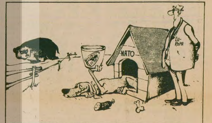
Avrupa: "Aferin NATO, şöyle iyici yumuşa, ama bir arada dişleini de göster"