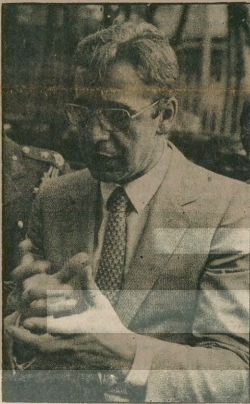
Eski İçişleri Bakanı Hasan Fehmi Güneş, terörü önlemek için AP-CHP işbirliğinin şart olduğunu, AP Grup Başkanvekili Oğuz Aygün ise, önce teşhiste birleşmek gerektiğini söyledi.

● AP Grup Başkanvekili Oğuz Aygün ise, CHP ve AP koalisyonunu gerçekleştirse bile anarşinin önlenmesi için teşhiste ittifak sağlanması gerektiğini söyledi.