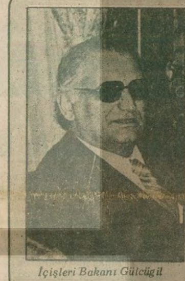
İçişleri Bakanı Gülcügil

İçişleri Bakanı, Nevşehir'deki cenaze törenine dışarıdan ateş edilmediğini iddia etti