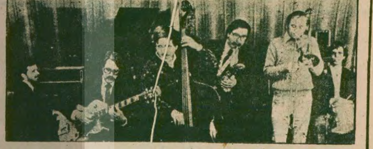
ABD Ulusal Caz Topluğunun son konseri bu akşam

● HÜRREM SULTAN oyununu, Esmelihan'ında, 21.30'da. Orhan Aşena'nın yazdığı, Halid Maral'ın sahneye koyduğu oyun, festivalde üçüncü kez sergileniyor. Fiyatlar: 100, 75 lira.