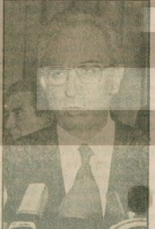
İtalya Başbakanı Cossiga

MSP'nin «16 şartı», bakanlık pazarlığına dönüşüyor