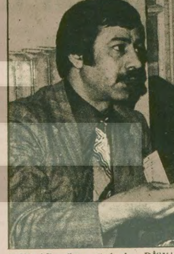
İŞİKLAR: Son günlerde, DİSK'te "birlik" ve "beraberlik"ten en çok söz eden kişi İşıklar Genel Kurul-da, "kanallararası" denge unsuru rolü-nü oynayacağını söyleyenler çoğun-luğa.