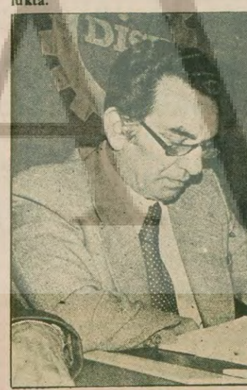
GÜVEN: Tekstil Genel Başkanlığı-nu kaybetmesine rağmen, DİSK'teki me-sasının önemli bir kısmını Tekstil'in sorunlarının çözümüne ayırıyor. Son günlerde başı Tekestil grevleri ile o-ldukça sıkışık olan Güven'in DİSK Genel Kurulu ile pek ilgilenemediği gözleniyor.