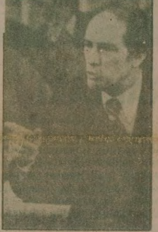
Kanada Başbakanı Trudeau