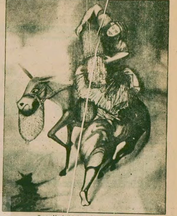
Önem'in tablolarından bir örnek

● Bu serginizde çok değişik çalışmalarınız bir arada yer alıyor. Bunlar arasında daha figüratif nitelikte karsal kesim çalışmalarınız dikkati çeker. Geçtiğiniz resim çiz-