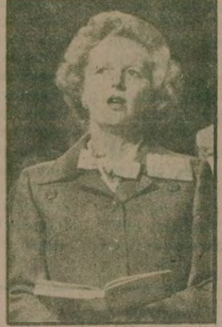
İngiltere Başbakanı Thatcher

OKULA BAŞLAYAN KOMANDOLAR Öğretmen ve öğrenciler, yeniden okuma hakkı tanınan 2 bine yakın komandanın olay (Devamı Sa. 6. s. 1)