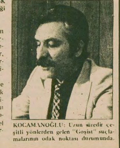
KOCAMANOĞLU: Uzun süredir çeş-itli yönlere gelen "Goşist" suçla-malarının odak noktası durumunda.