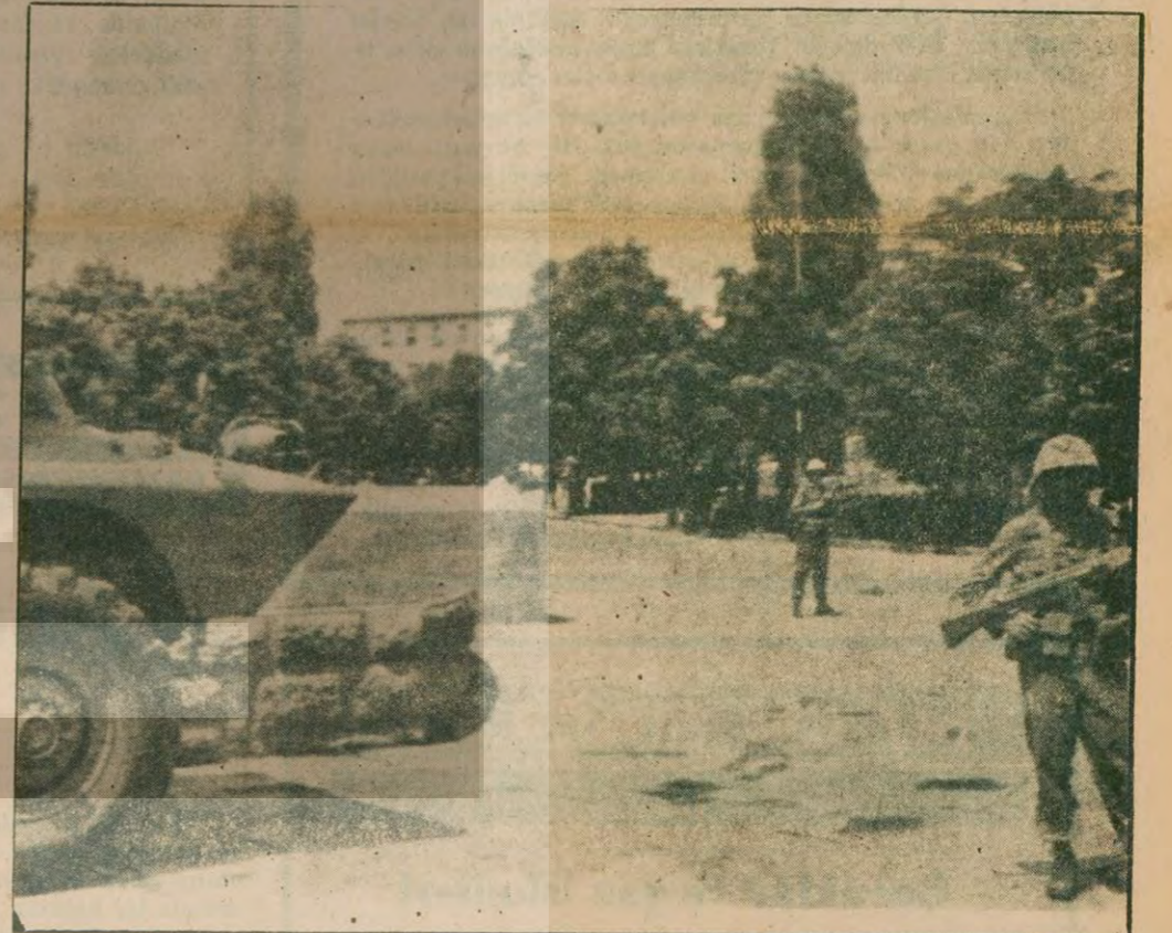
Cenaze töreni sırasında Meclis civarında geniş güvenlik önlemleri alındı.