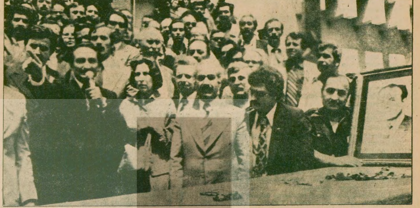
Ecevit, Nevşehir CHP İl Başkanı Zeki Tekin'in cenaze töreninde konuşurken.

• Ecevit: "Nevşehir'de yaratılmak istenen durum, işgal altındaki ülkelerde bile görülemeyecek bir durumda"