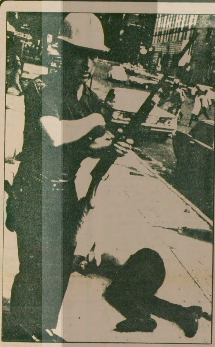
Güney Afrika'da Sowo to katliamının 4. yıldönümünde Irkçı G. Afrika polisi 60 siyahi öldürdü. Resmi olmayan rakamlara göre, bu çatışmalarda 200'den fazla insan da yaralandı. Siyah halkın yoğun olarak bulunduğu Cape Town bölgesinde çıkan çatışmalardan sonra bölgenin su an salin olduğu ancak bölgeye çok sayıda polis sevki edildiği bildirildi.

ANKARA (ÖZEL) M. ALİYE Bakanı İsmet Sezgin, Uluslararası Para Fonu (IMF) Yönetim Kurulunun Washington'daki toplantısı sonunda Türkiye ile Fon arasında üç yıl için düzenlenen yeni Stand-by Anlaşmasını onaylandığını bildirdi. Sezgin, Türkiye'nin anlaşma ile Fon kaynaklarından üç yıl içinde bir milyar 600 milyon dolarlık çekiş yapacağını söyledi. Washington'daki Türk yetkililerle görüşmelerini belirten Sezgin, toplantıda Türkiye'nin aldığı ekonomik tedbirlerin olumlu karşılandığını, Türkiye'ye Fon dışından öteki kay- (Devamı Sa. 6 Sü. 1)