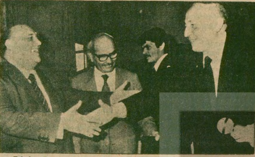
Erbakan Demirel ile 2 saat 20 dakika süren bir görüşme yaptıktan sonra yine "sürücümüne" yolunu seçti ve pazarisesiye kadar hükümete mühlet tanıdıklarını söyledi. Erbakan, Demirel'in 1980 Haziranı Türkiye'sinin Kasım 1979 Türkiye'sinden daha kötü olduğunu kabul etmediği takdirde sorunu tedavi edemeyeceğini söyledi.