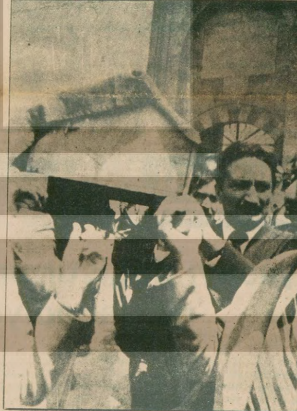
Nevşehir CHP İl Başkanının cenaze törenine Ecevit ve 100'e yakın parlamenter katıldı.

• Törende faşizmi lanetleyen sloganlar bağırdı