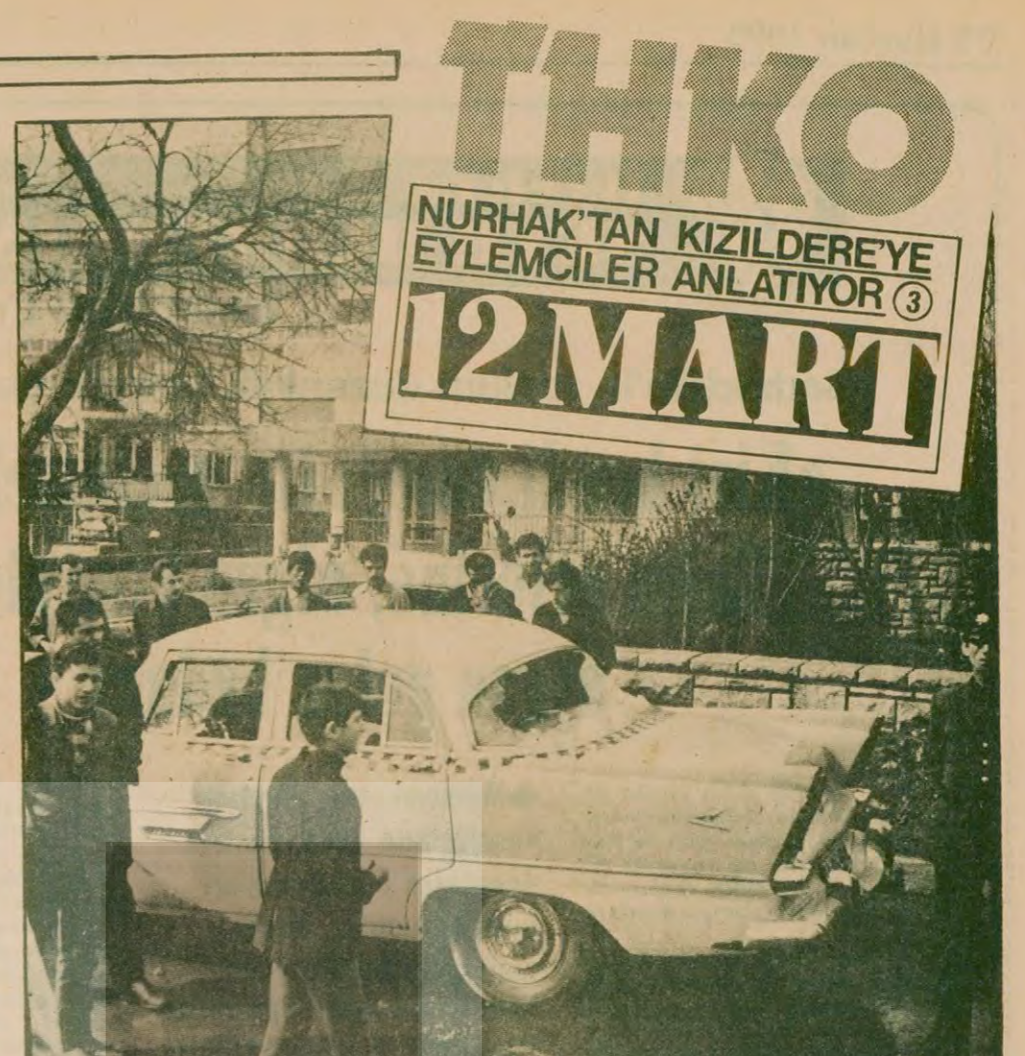
- 5 Mart sabahı, soygundan yarım saat önce gasbedilen araba ile bankanın önüne geldiler. Soygundan sonra kullanılan araba arka camı kırık vaziyette Üsküdar civarında bir çitmez sokakta bulundu.