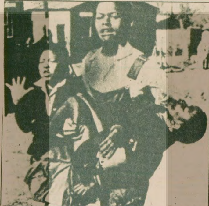
Bundan 4 yıl önce Irkçılar Sowo to da 600 yerli siyahı katlettiler. Irkçıların öldürdüğü bir çocuk babası tarafından taşınırken tüm dünya Irkçıların bu vahşi eylemlerini neflele kınıyor.