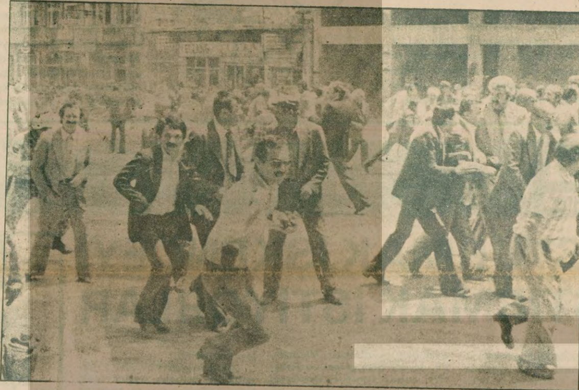
Silahlı saldırı üzerine korunmaya çalışan CHP'li parlamenterler ve cenaze törenine katılan halk.