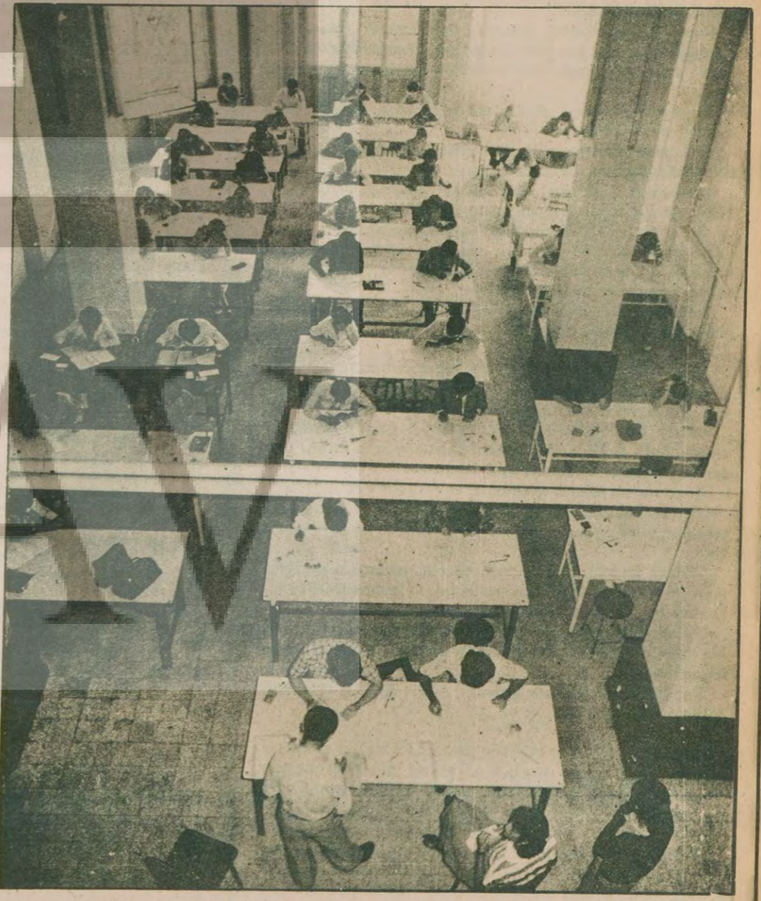
Üniversite kapısına dayanıyor çoğalıyor. Kapı genişlemiyor. Kontenjan sabit. Yıllardır giderek patlama noktasına yaklaşan sorunu devlet ilgisiz kalıyor.