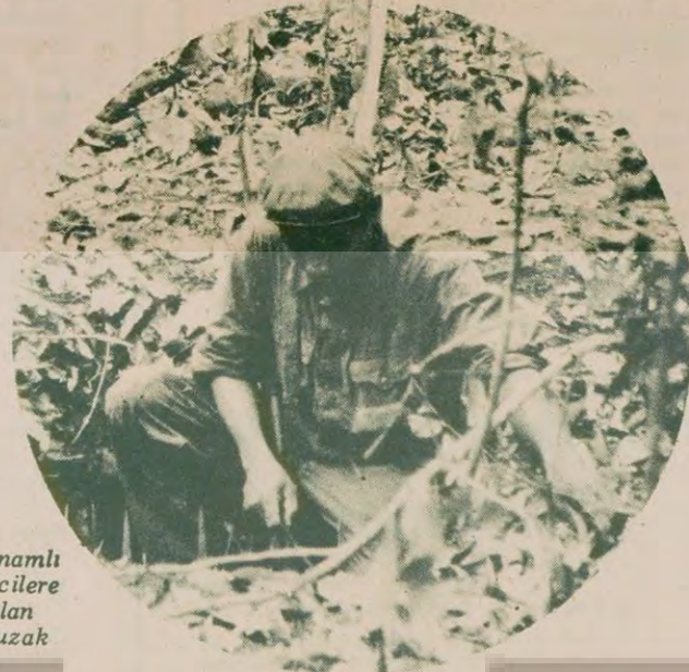
Vietnamlı işgalcilerle kurulan bir tuzak