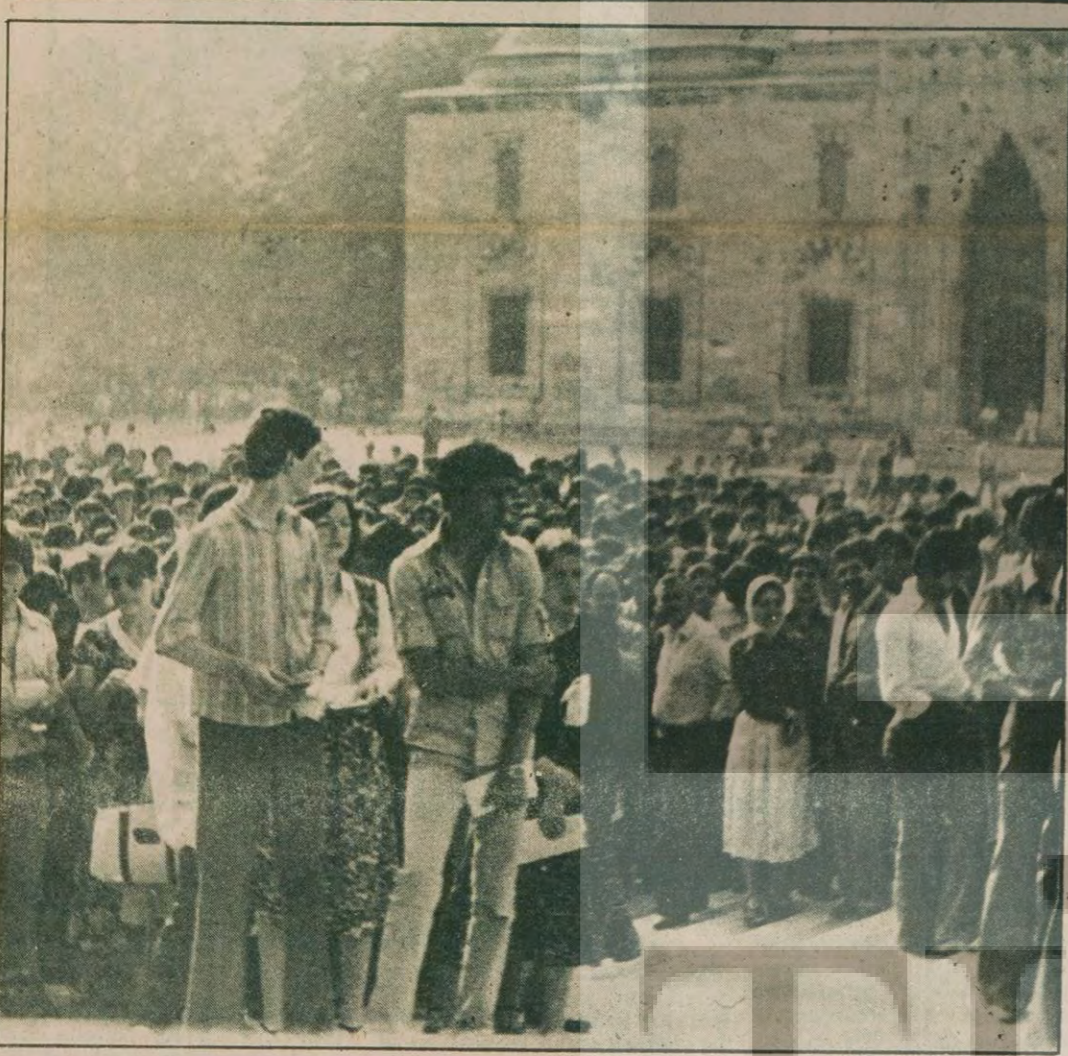
Yüzbinlerce öğrenci sonucu şimdiden belli olan sınav için cuma gününü bekliyor.

● Komandolarla jandarma ve polis arasında Adana'nın çeşitli mahallelerinde üç saat süren silahlı çatışmalar oldu