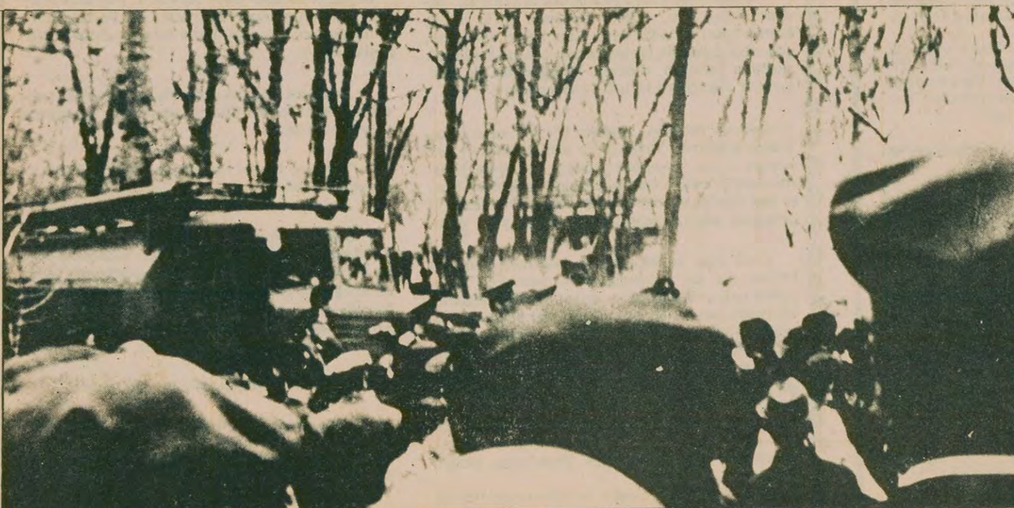
Sovyet polisi, baskılara ve zulme karşı mücadele eden Kırım Tatarlarının bir gösterisini zorla dağıtmaya çalışırken.

"1944-57 arasında kendi dilimizden kitap çıkarma olanağımız yoktu... 1968'de sözde bir Tatar Enstitüsü kuruldu. 1944 öncesinde Kırım'da kütüphanelerimiz, okullarımız vardı. Hepsi yakılıp yıkıldı. Tüm kültür mirası yok edildi."