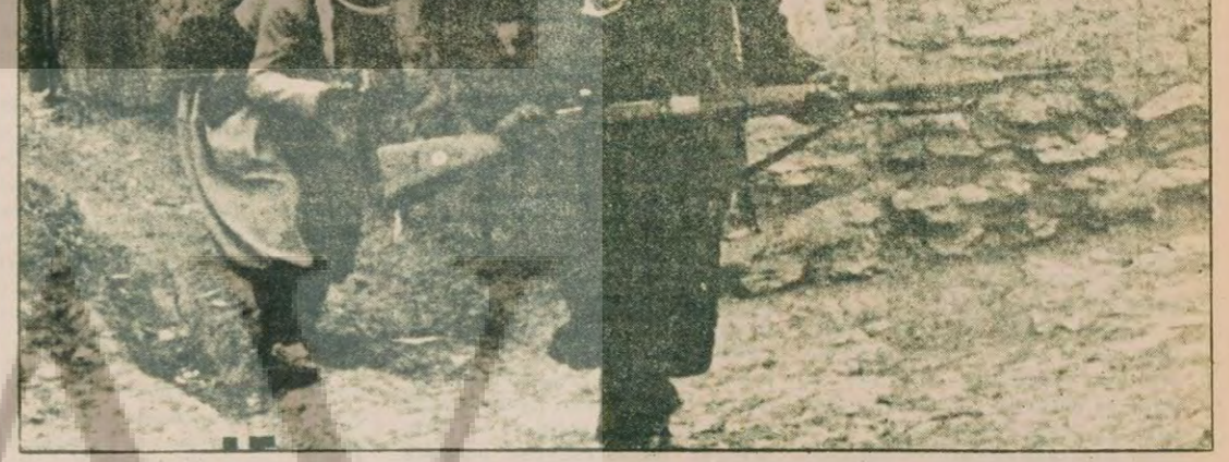
Nagadeh kentinde İran ordusu birliklerine karşı koymaya hazırlanan iki Peşmerge.

ANLAŞMAYA UYMAMA Ancak Homeyni yönetimi Kürtlerin taleplerini yerine getirmedi, adım adım bu taleplerin tersi yönünde uygulamalara girdi. Çünkü Homeyni yönetimi İslam dini ile milli meselelerin çözümlenmesini istiyordu. İslamın özüne giderek de bütün dünyada sınıflar milliyetlerarası farklılıklar ortadan kaldıracağını düşünüyordu. Bakış açısı böyle olunca da hiç bir mesele çözülmedi. Tam tersine süper devletlerin ve Şah kalıntılarının yararlanacağı bir durum Kürdistan'da kendini göstermeye başladı. Ve bölge kanyan bir yara haline geldi.