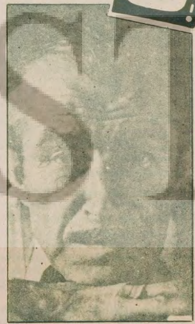
Yaşadığını yazan ve yazdığı gibi yazan yazarımız Orhan Kemal

Yaşamında değeri bilinmeyen yazarımızın hiç olmazsa ölüm yıldönümü dolayısıyla hazırlanan 30 dakikalık bir programda kısıtlama ya da sansür uygulanmamasını ümit ederek bekliyoruz.