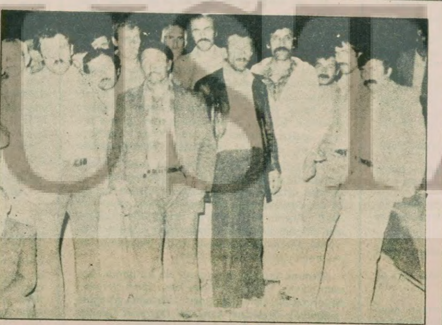
Yenimahalle halkı 2 yıl önce kazılan ve açığa çıkan kuyunun bir an önce kapatılmasını istiyorlar.

CEZAYİR (AA) BİRLEŞMİŞ Milletler Namibya Konseyi'nin 5 gün süreli olağanüstü konferansı pazar günü Güney Afrika Cumhuriyeti'ne karşı ekonomik yaptırım uygulamasını için çağrı yapıldı. Konsey, BM üyesi ülkeler yaptığı diğer bir çağrıda ise, Güney Afrika Cumhuriyeti'nin yalnız bırakılması için etkin ve eksiksiz çabaların yoğunlaştırılması istedi. Konsey, bütün ülkelerden, Güney Afrika Cumhuriyeti yönetimindeki tüm topraklarda BM denetiminde yapılmayan seçim ve düzenlemelerin tanınmasını istedi. Konsey aldığı kararlar arasında Namibya'ya ait uranyumun Güney Afrika Cumhuriyeti tarafından yasadışı yollarla sömürülmesi konusunu incelemek üzere soruşturma yapılmasını ve Güney-Batı Afrika halkı Örgütü SWAPO'nun Namibya halkının tek temsilcisi olarak desteklenmesi yer alıyor.