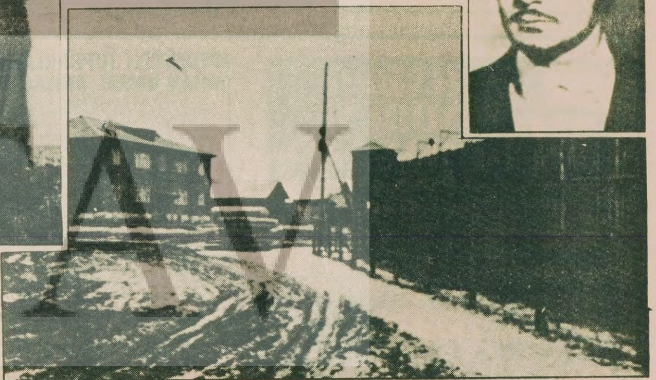
Sykytykar Çalışma Kampının genel görüntüsü

Öte yandan Sovyet kanunlarına göre yasal olmasına rağmen örgüt kurdukları için yargılanan kimselerin adları da raporda yer alıyor. Bu örgütler arasında, Helsinki Anlaşmasını uygulamamasını ya da akıl hastanelerinde yapılanları denetleyen gruplar, "SSCB'deki Özgür İşçi Sendikaları Birliği" ve "Özgür Mesleklerarası İsciler Sendikaları" bulunmaktadır.