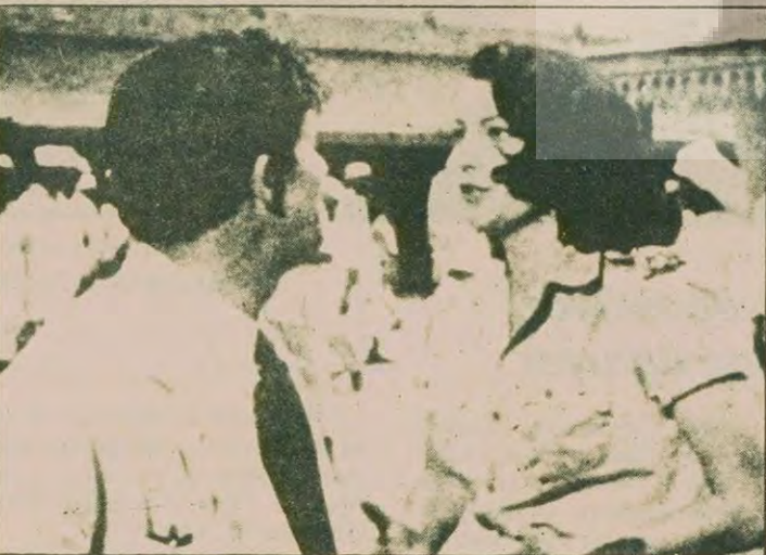
Bir zamanların ünlü artistü Ava Gardner yıllar önce sinemayı bıraktı.