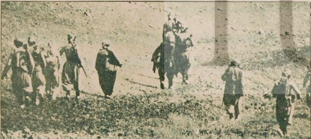
Iran Kürdistanı'ndaki çarpışmalardan kaçan çok sayıda insan dağlara çekilmek zorunda kaldı. Fotoğrafta bir grup Kürt, dağ yolunda.

Hükümet, Sanandaj bölgesine ağır silahlar yığıyor