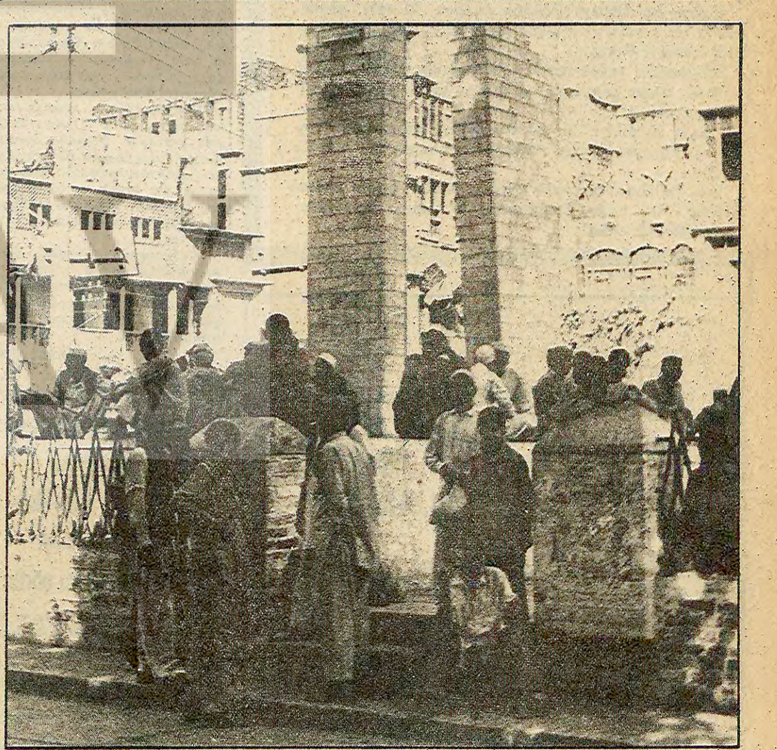
Kabil'de ve başka kentlerde öğrenciler Rus işgali sürdüğü kitaplarını açmayacaklarını belirtiyorlar. Derslere girmeyen bir grup öğrenci Kabil sokaklarında görülüyor.

Weizman Mısır-İsrail görüşmelerinde "İlim" bir unsur olarak nitelendiriliyordu. Ezer Weizman bir süredir özellikle Yahudi yerleşim merkezleri konusunda farklı düşüncülerini ve istifa edeceğini söylüyordu. Weizman genelinde İsrail Televizyonunda yaptığı bir konuşmada da, Begin (Devamı Sa. 6 Sü. 4)