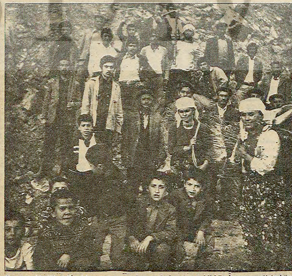
Bıçakçı köylüleri "İşçi kıyımı, memur kıyımı derken sıra geldi köy kıyımına. Sizin köyden bize 5-10 oy çıkıyor diye dozerimizi elimizden aldılar" dediler.