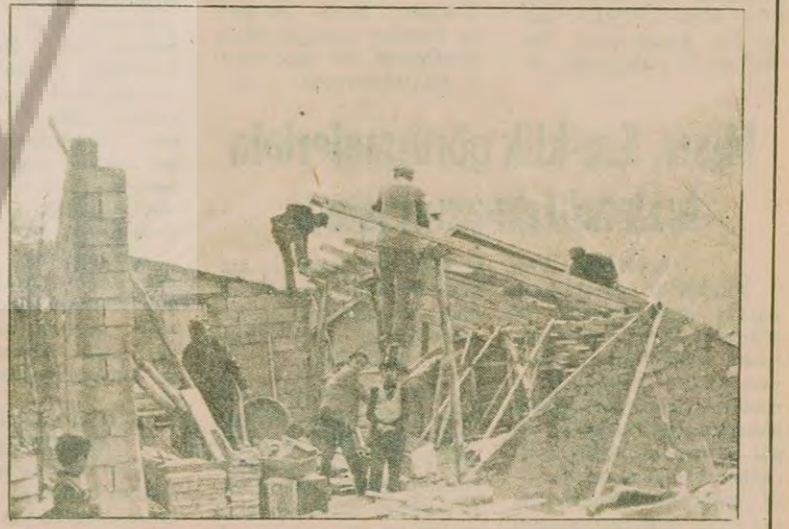
Pülümür halkı şiddetli fırtına ve selden yıkılan evlerini onarmaya çalışırken, devletin bir tek çadır bile göndermediğini belirtiyor.