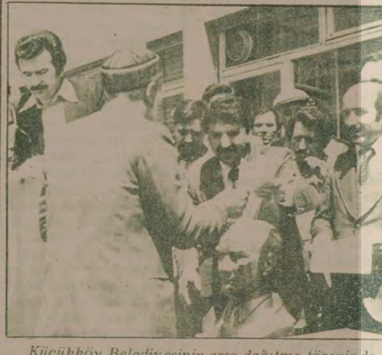
Küçükköy Belediyesinin arsa dağıtım töreninde yurttaşlara arsa evrakları verilirken.

Küçükköy Belediyesinin dar gelirli yurttaşları ev sahibi yapabilmek amacıyla 1978 yılında çalış-