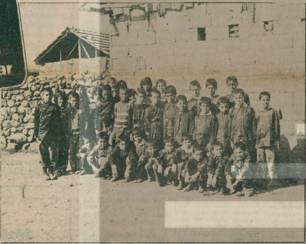
İncirli köyünün 80 çocuğu ilköğrenimlerini ahırda yapıyor. Penceresiz, kapısız binada tahminen ne kadar kalacakları da belli değil.

MEHMET ÖZDEMİR (İSLAHIYE) İSLAHIYE'nin İncirli köyünde 80 ilkököl öğrencisi öğrenimini 1979'un ekim ayından beri ahırda yapıyor. İlk okul binası hâlâ tamir edilmediğinden öğrenim bir süre daha ahırda sürecek. Çok kötü şartlar altında (Devamı sa. 6. s. 7'de)