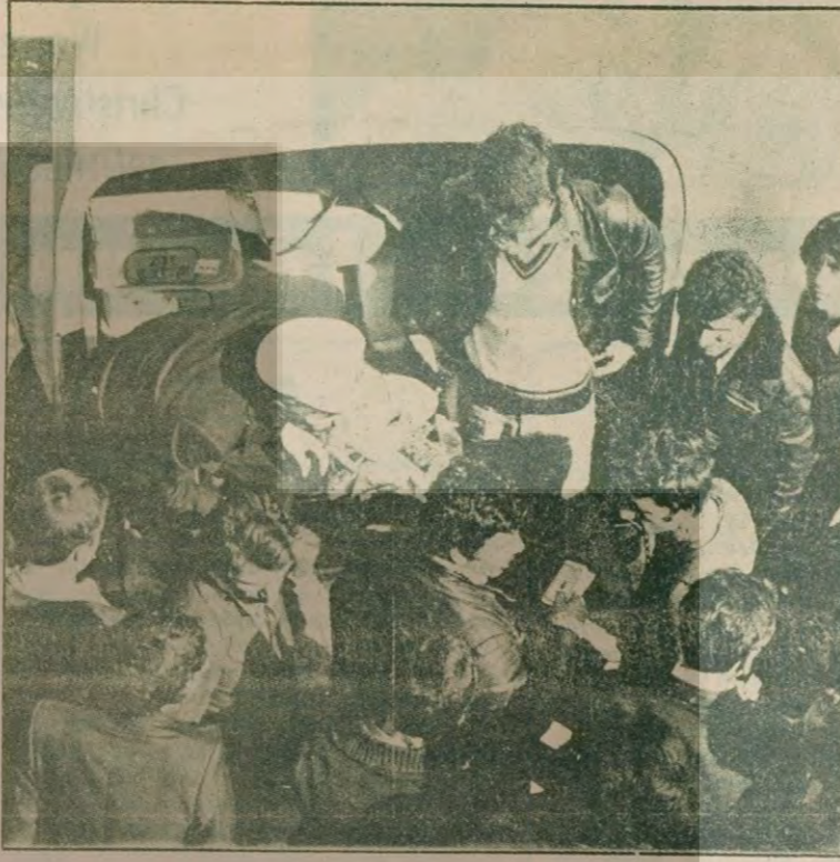
Üretimi ülkemizde bol miktarda olmasına rağmen tuz sık sık karaborsaya düşüyor. Fotoğrafta stok tuz ele geçirilip dağıtan belediye ekipleri.

Çanakkale Boğazından İskenderun'a kadar 17 tuzludan ancak bir tanesinin işletilemeye hazır olduğu bildirilen araştırmada Türkiye toplam tuz rezervinin 150-200 milyon ton dolayında bulunduğu belirtildi. İstanbul Ticaret Odası araştırmalarında 1977 yılında 1 milyon 800 bin ton tuz üretimi planlanmış iken, bunun ancak yüzde 35 oranında gerçekleştirildiği ve 660 bin ton tuz üretildiği belirtildi.