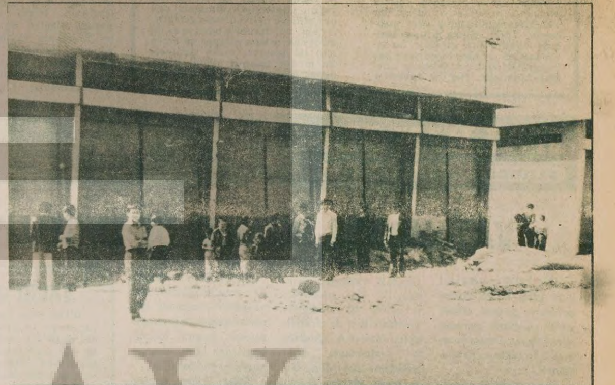
Tarsus'taki olaylar sırasında dışardan ateş edilerek içeriye sığınanlardan iki yurttaşın öldürüldüğü söylenen atölyeler...

Olay sırasında bu dükkanlara sığınanlar dışardan taranmış