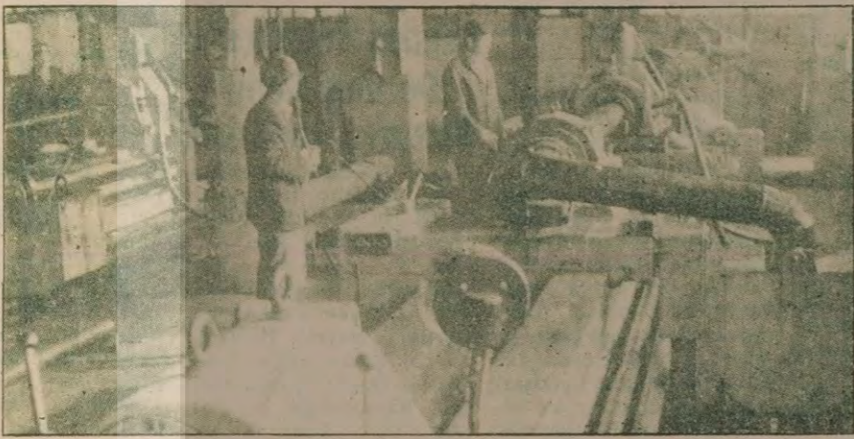
Demir Çelik İşletmelerine uygulanmakta olan sübvansiyonun kaldırılması, yeni yatırımlar yaparak maliyeti düşürme olanakını ortadan kaldırdı.