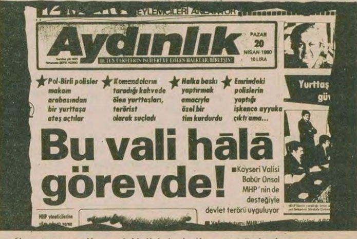
Gazetemizin Kayseri Valisinin halka yaptığı baskıları yansıtan yayınının kopyası.

ANKARA (ÖZEL) CHP Kayseri Milletvekili Mehmet Gümüştü, önceki gün TBMM'de Kayseri Valisi Babür Ünsal'ın, silah kaçakçılığından yargılanan Hacı Mirza adlı bir kişi ile içki masasında çekilmiş bir fotoğrafını dağıttı. Gümüştü, konuşuya ilgili yazılı açıklamasında da şöyle dedi: "Kayseri Valisi Babür Ünsal ile silah kaçakçılığı sanığı Hacı Mirza'nın aynı içki masasında eğlendiğini gösteren bu fotoğraf, aynı zamanda Kayseri'deki huzursuzluğun nedenini de belgeliyor." "Babür Ünsal ile birlikte Kayseri'de terör, baskı ve zulum bugün dökülmemiş boyutlara ulaştı. 'Kayseri halkına yaşama zindan (Devamı Sa. 6 Sü.2)