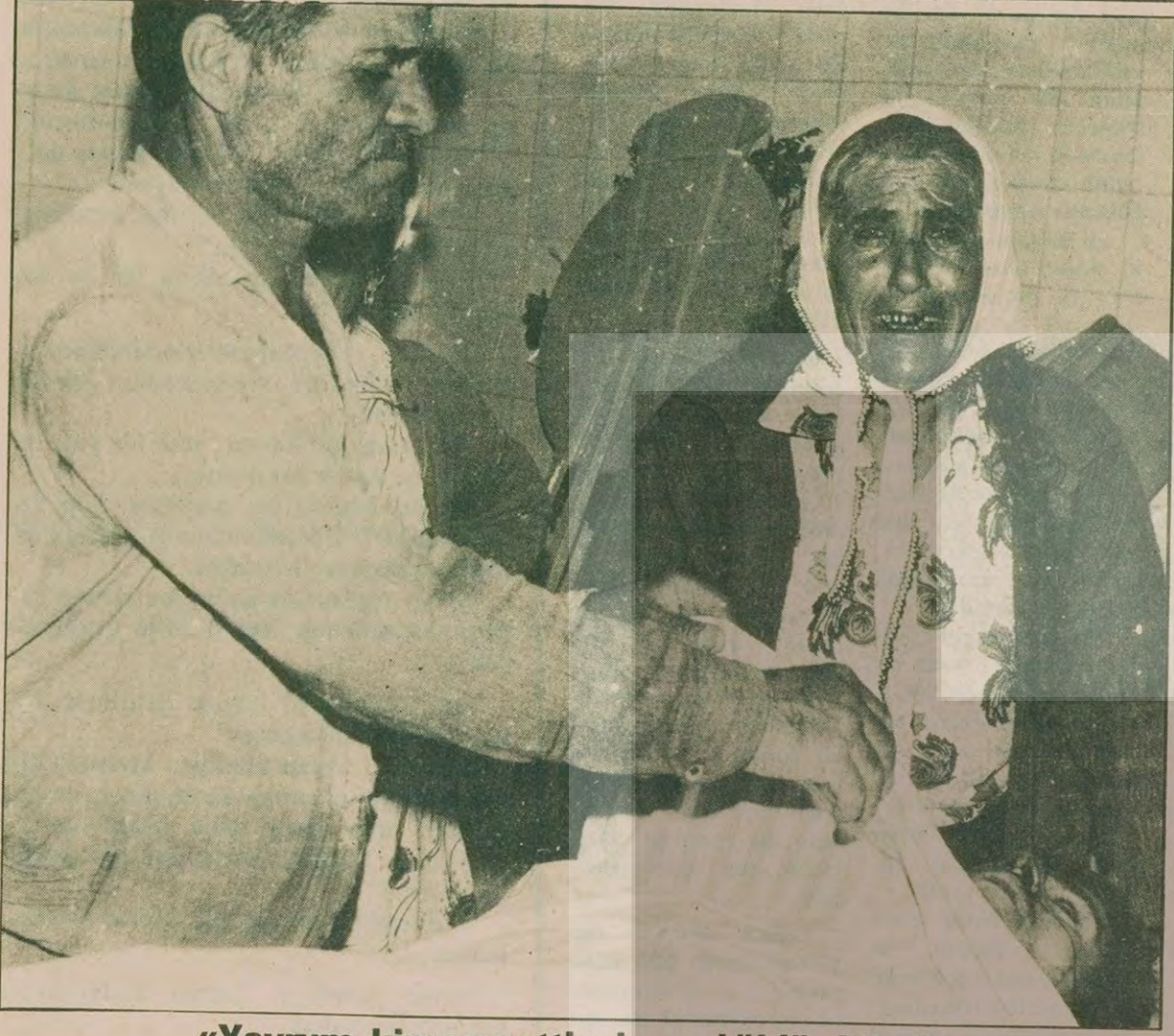
«Yavrum, kime ne ettin de seni öldürdüler?»

Jandarma ve polis açtığı ateş sonucunda ölen yurttaşlardan birinin anası böyle ağlıyordu, cenazenin başında. Lise öğrencisiydi. İki aya kalmadan bitirecekti okulu. Sonra? Sonrasını düşlemeye mecali kalmadı anasının. Nasıl kalsın ki, işte toprağa veriyordu gençlik fidanını. "Gençti" diyor ağabeyi, "gençti ama gitti işte. Arkadan vurmışlar hem de. Bu nasıl iştir?"