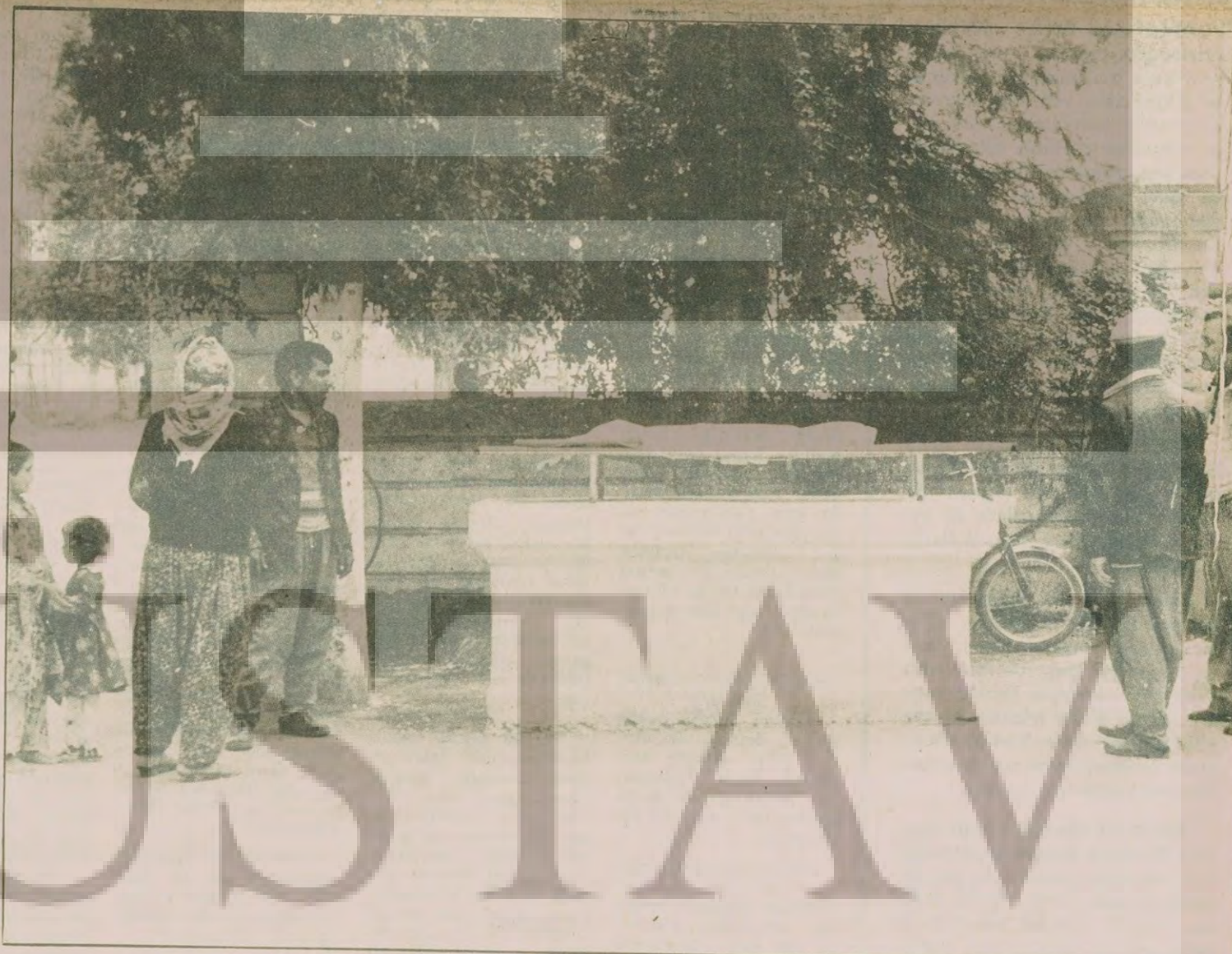
"Bebem, bugün senin bayramın duyurmuşsun ki beni..."

Jandarma kurşunuyla ölen dokuz yurttaşın biri. Küçük bir çocuk. Henüz altı yaşında. Dün sabah evin civarında evinin önünde yaşlılarıyla. Bugün ise musalla taşında. Yanında, yöresinde başka bebeler de var. Ve bugün, 23 Nisan. Onların bayramı...