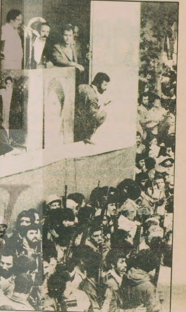
Beni Sadr Tahran Üniversitesinde konuşurken, silahlı muhafızlar etrafı gözetliyor.

GÜNEY YEMEN'LE İLİŞKİ Iran, Doğu Blokuyla anlaşmalar imzalarırken, Güney Yemen ile de diplomatik ilişki kurduğunu açıkladı. Tahran yönetimi, Güney Yemen'in "emperyalizme ve siyonizme" karşı mücadelette olduğunu ileri sürdü.