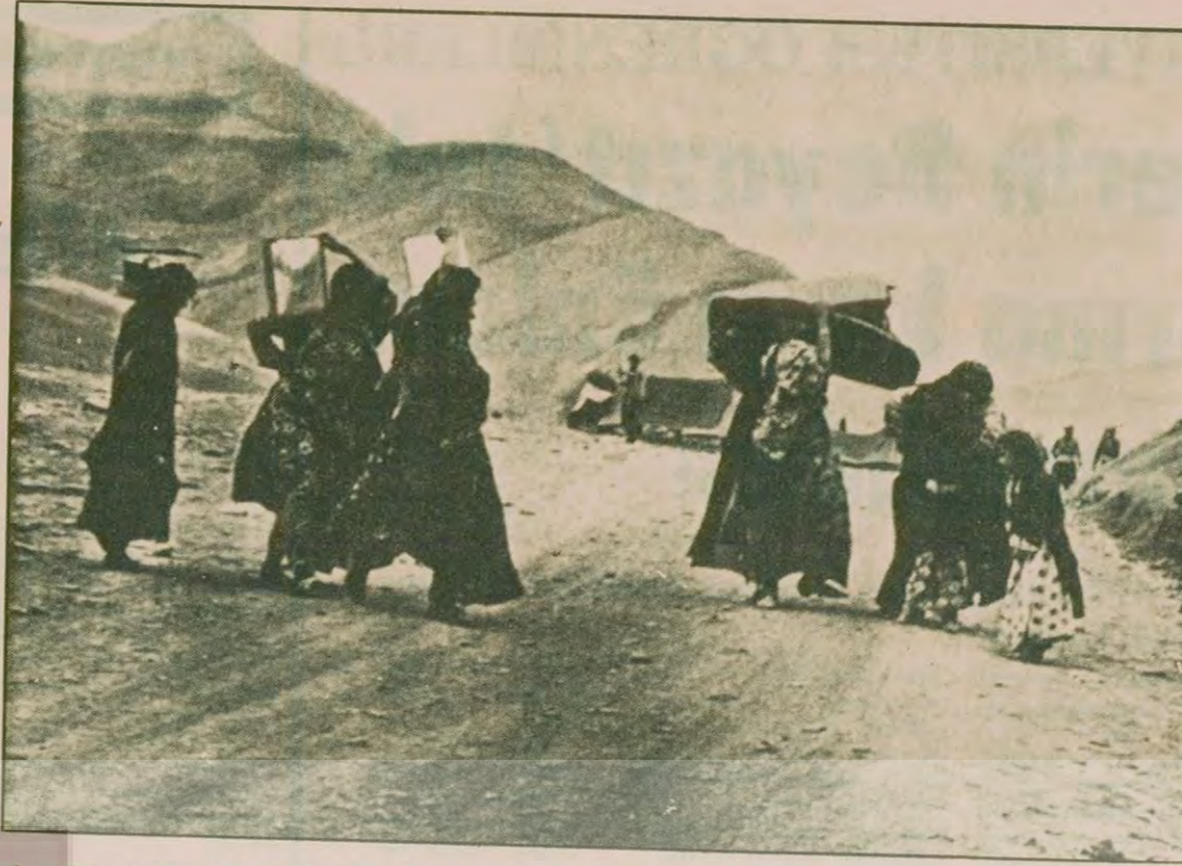
Iran Kürdistanı'nda ayrılıkçı gruplarla hükümet kuvvetleri arasındaki çatışmalardan insanlar ev eşyalarıyla başka yerlere taşınmak zorunda kalmışlardır. İşte eşyalarını taşıyan kadınlar.

Schmidt'in yakında Brejnev'e görüşeceğini hatırlatan yorumcular, SPD'nin içindeki yumuşama yanlısı Wehner kadınının, füzeler konusunda Schmidt'e baskı yaptığını belirtiyorlar. SPD'nin Parlamento Grup Başkanı olan Wehner halen Kremlin yetkilileri ile temaslarını sürdürürken, Schmidt Moskova'ya yapacağı gezinin hazırlıklarını tamamlıyor.