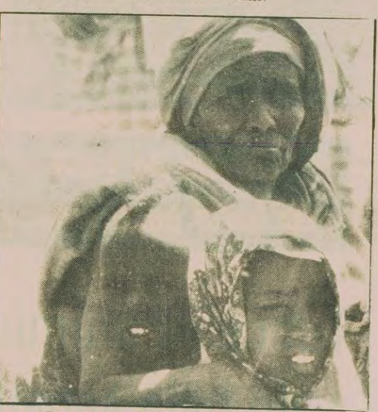
Somali'deki Etyopyalı göçmenler.

Sir Ian Gilmore, basın toplantısında, Birleşmiş Milletler kararlarını küçümsemek istemediğini, ancak bunların sorunları çözmeye yeterli olmadığını kaydetti. İngiltere Dışişleri Bakan Yardımcısı şöyle dedi: "Sadece Birleşmiş Milletler kararları sorunları çözmüş olsaydı, dünyada hiç bir sorun kalmazdı. Birleşmiş Milletler kararlarını veya New York'ta sağlanan zaferlerin önemli olmakla birlikte Kıbrıs sorununun çözümeceğinin anlaşılmasını istiyorum."