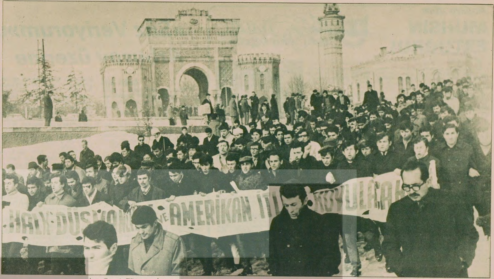
Amerikan 6. Filosunun İstanbul'a gelişini protesto için yürüyüşe geçen İstanbul Üniversitesi öğrencileri