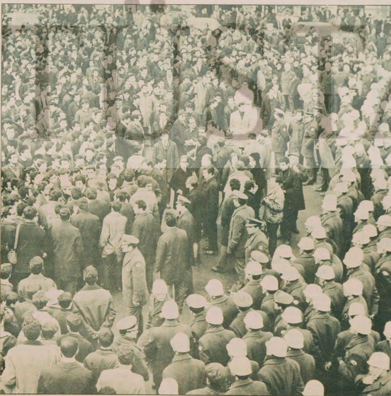
Gençlerin Taksim'de yaptıkları bir gösteri polisler tarafından engellenmeye çalışılırken

Ve arkasından da Dev-Genç'in 12 Mart'ı destekleme bildirisi yayınlandı.