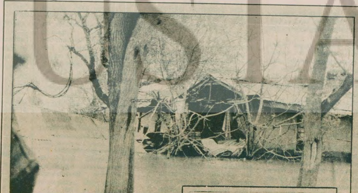
Hamitbey'de sağlam kalan ev yok gibi. Sular yatak, yorgan, mazot bidonu, gübre, saman ne bulduysa, önüne katıp Akdeniz'e indirdi.

Besiktas Spor Caddesinde kimlikleri belirlenemedi. (Devamı sa. 7. s. 8'de)