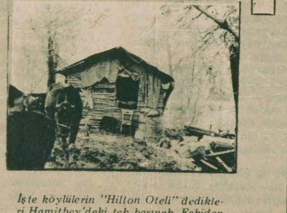
İşte köylülerin "Hilton Oteli" dedikleri Hamitbey'deki tek barınak. Eskiden zibillik olarak kullanılan bu yer şimdi onlarca insanı barındırıyor.

ÇETİN DEMİRKAYA VE FARUK PULAT'IN YAZISI YAZISI 7. SAYFADA