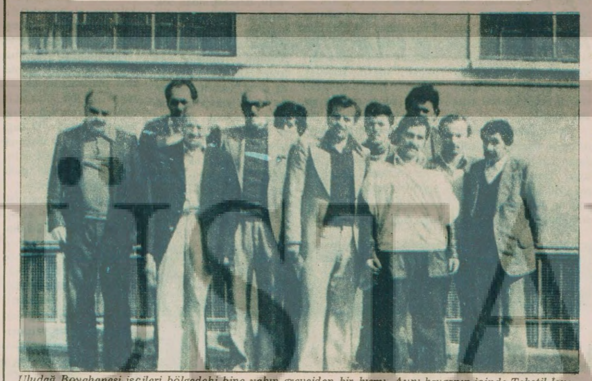
Tekstil grevindeki Uludağ Boyahanesi işçileri: