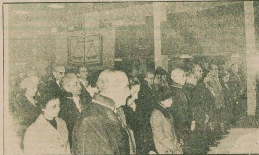
Istanbul Barosunun 102. kuruluş yıldönümüne çok sayıda avukat katıldı.

Istanbul Barosunun 102. kuruluş yıldönümü kutlandı Apaydın: "Özgürlük düşmanlarının baskıları karşısında boyun eğmedik, eğmeyeceğiz"