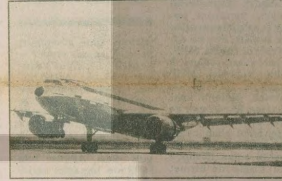
İşte ünlü dev yapıtı AIRBUS uçakları. Şu anda dünya pazarında ikinci sırada bulunuyor ve bütün dünyada sadece 75 AIRBUS uçağı sefere çıkmış durumda.

Öldürülmek istenen ülkücüyle birlikte kahveden çıkınca canından oldu