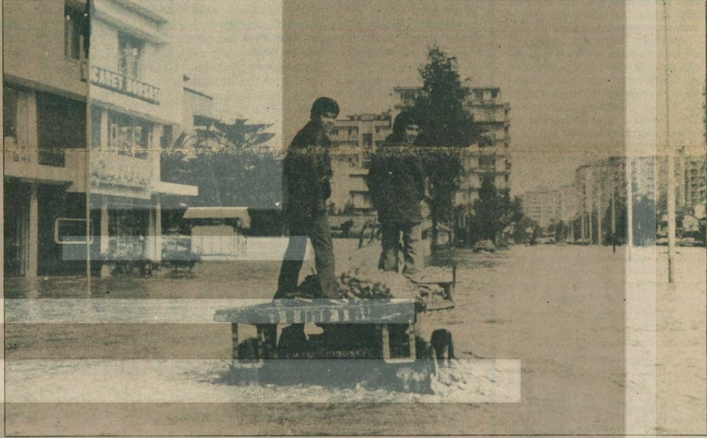
Ülkemizin en önemli tarımsal üretim bölgelerinde üreticiler ilkbahar ekimine başladıkları sırada meydana gelen sel felaketinden büyük zararlar gördü.

HABER MERKEZİ SON günlerde meydana gelen heyelan, sel ve yıkıntılar can ve mal kaybına yol açarken, sel felaketine uğrayan esnaf ve üreticilerin banka borçlarının ertelenmesi ve bunlara kredi verilmesi istendi. Özellikle, Kayseri, Adana, Kars, Gaziantep, Konya'da etkili olan ve can kaybının yanı sıra, ekili alanları sular altında bırakan, ekilecek alanları da ekilemez duruma getiren seller birbir güçlük içindeki üreticileri zor duruma soktu. Kars'ta aralıksız olarak yağın yağmur ile eriyen kar sularının yüzlerce ev ve işyerini kullanılmayacak hale getirmesi üzerine, çeşitli demek ve sendikalar, işyerlerini su basan felaketzedelerin banka borçlarının ertelenmesini ve bunlara kredi verilmesini istedikler. Evleri yıkılan vatandaşların da bir an önce eve kavuşturulması gerektiği belirtildi. Üreticiler Adana'nın sular altında kalmasıyla milyarlarca liralık zarara girdiler. Felakete uğrayanlara her türlü yardıminin yapılacağını açıkladılar. (Devamı sa.7, sü.3'te)