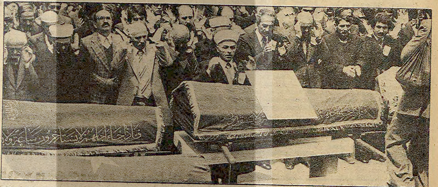
BİRİNCİ SINIF CENAZE - Yeniden belirlenen cenaze kaldırma ücretlerine göre birinci sınıf cenaze kaldırma 10 bin liraya, ikinci sınıf 6 bin, üçüncü sınıf ise 2 bin 500 liraya mal oluyor. Soğukhava tesislerinden yararlanma ise 500 lira ile 2 bin lira ücretine tabi.

ULAŞIM ÖLÜ İÇİN DAHA PAHALI - İstanbul'dan Kadıköy'e cenaze bin liraya naklediliyor. Beyoğlu, Kadıköy arasındaki nakit bin, Belediye hudutları dışında gidis dönüş ücreti için ise kilometre başına 20 lira ödeniyor.