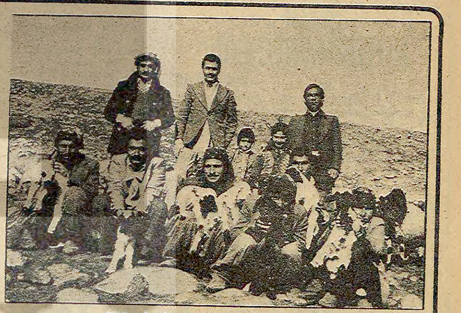
Sürüye katılmayan hastalıklı koyunlar.

VETERİNER İLAÇ YEM YOK VAAT ÇOK Bir çoban da kuzuları