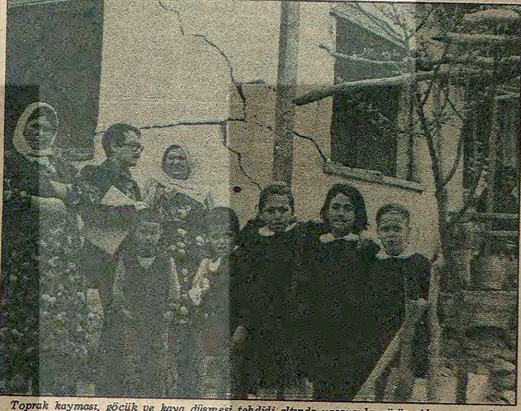
Toprak kayması, göçük ve kaya düşmesi tehdi altında yaşayanlar sırıp giden yazışmaları yıllardır bekliyor ama doğa çoğu kez bu kadar sabırlı davranmıyor. Doğal afetler çocuk çocuk, birçok yurttaşımızı evsiz barsız bırakıyor.

Çok sayıda köy ve kasaba heyelan tehdi altında