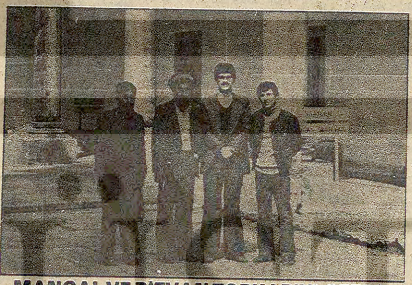
MANGAL VE RIZVAN TOPKAPIYI GEZDİ Ülhemizi ziyaretleri sırasında Topkapı Sarayını da gezen Afgan direniş kuvvetlerinin temsilcileri burada görüldükleri İran ve Afganlılarla da konuştular.