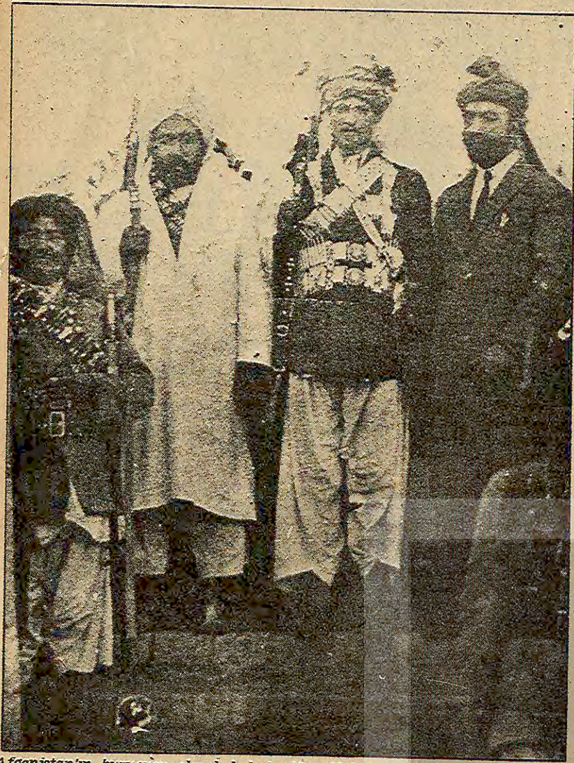
Afganistan'ın kurucusu olarak kabul edilen Habibullah Han (sağdan birinci) arkadaşları ile Kabil'e geldikleri gün çekilmiş fotoğrafları