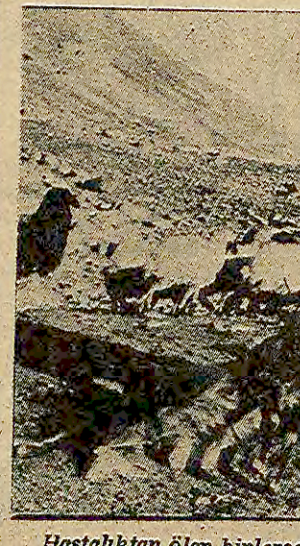
Hastalıktan ölen binlerce hayvandan biri.

Köye doğru ilerlediğimizde adım başı koyun, kuzu cesetleri ile karşılaşılıyor, arkların, derelelerin içine atılmış. Köpekler ağzlarına birer kuzu leşi almış, kuytu köşelerde parçalayıp yiyorlar. Sürü sahiplerinin, çobanların yizlerinden düşen bin parça... Bütün bu olanların nedenlerini öğrenebilmek için ilk olarak Muhtar Halil Yıldırım'ın yanına gidiyoruz.