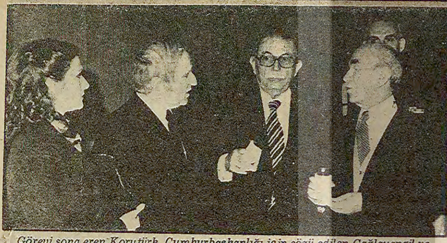
Görevi sona eren Korutürk, Cumhurbaşkanlığı için sözü edilen Çağlayangül ve Karakas'la.

Cumhurbaşkanlığı için henüz resmen adaylığını koyan yok