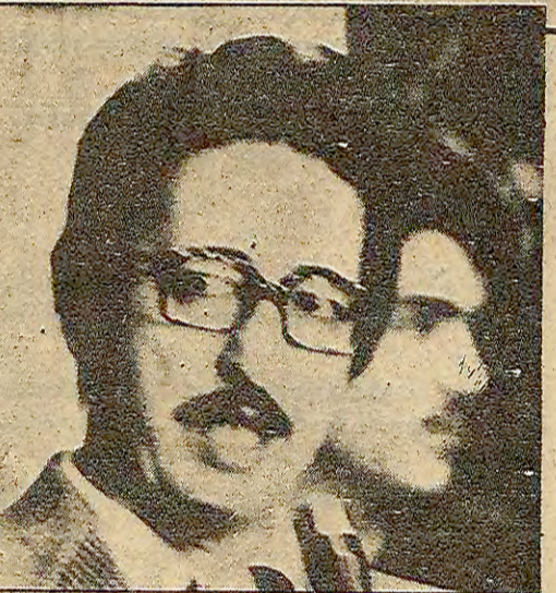
An'daki seçimlerin Beni Sadr'ı güçlendireceği tahmin ediliyor. Seçimlerde Beni Sadr'ın adayları ile Beheşt'in Nam Cumhuriyeti Partisinin adayları konuşuyor.

●Diyarbakır toplantısına Özgürlük Yolu, Şıvancılar ve KUK temsilcileri katıldı ●Daha sonra Ankara'da yapılan toplantıya ise bir Doğulu parlamenterin katıldığı bildirildi