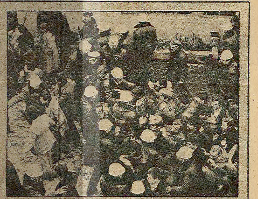
Santral Mensucat Fabrikasında işçilerin üzerleri güvenlik görevlileri tarafından aranırken yer yer çatışmalar çıktı çok sayıda işçi gözaltına alındı.

Andas: "Bizi sokağa dökmek isteyenlere fırsat vermeyeceğiz"