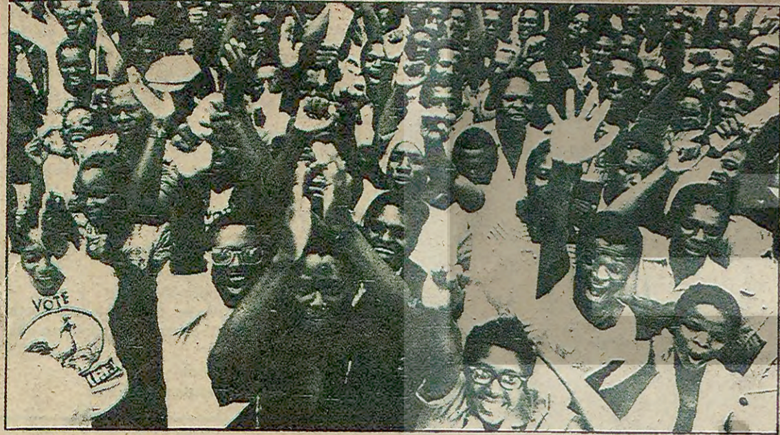
Zimbabve'de halk ZANU'nun zaferini coşkun gösterilerle kutluyor.

"Beyazlar her türlü kısıtlamadan ve suçlamadan uzak yaşayacaklar"