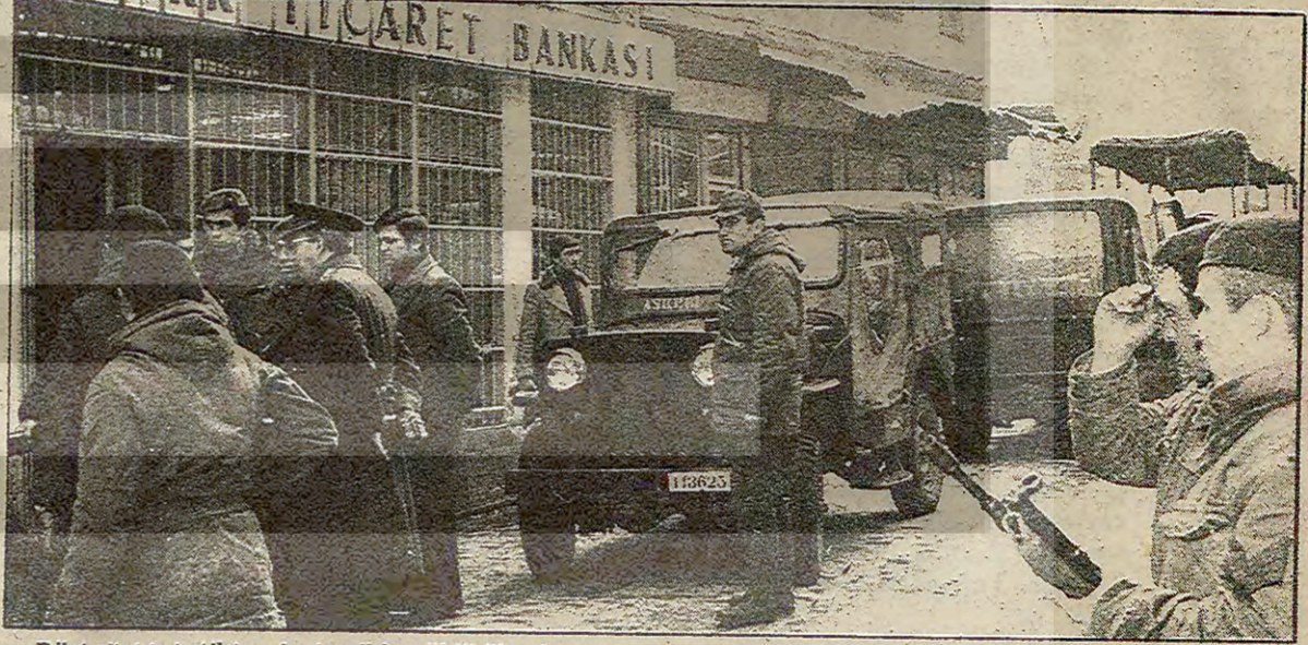
Dört silahlı katil tarafından iki er öldürülerek soyulan Türk Ticaret Bankası Mercan Şubesi

İSTANBUL'DA BİRİ KIZ DÖRT KATİL, İKİ ERİ ÖLDÜRÜP BANKA SOYDU