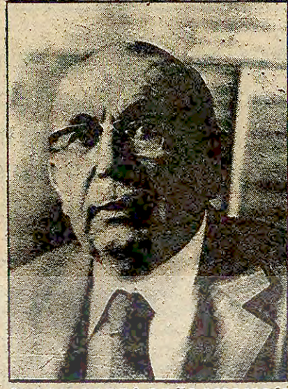
İHSAN SABRİ ÇAĞLAYANGİL