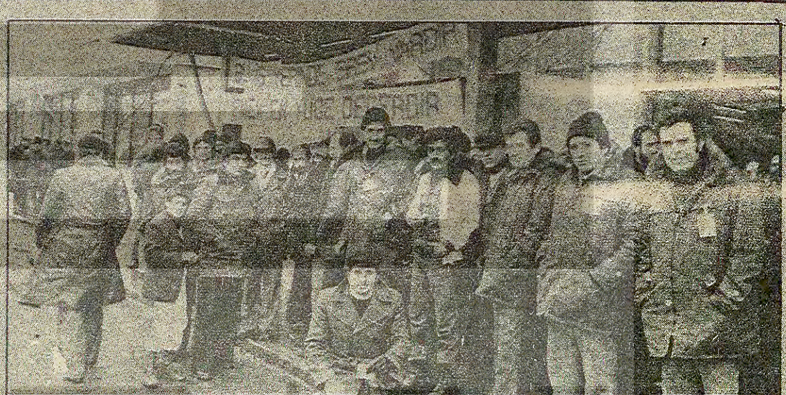
Bir haftadır grevde olan THY işçileri, grevi haklarını alana kadar sürdürüleceklerini açıkladılar. Ekonomik haklarının ve iş güvenliğinin sağlanması için mücadele ettiklerini belirten Hava-İş üyeleri, "Mücadelemizi saptırma veya karalama çabaları boşa çıkacak" diyorlar.