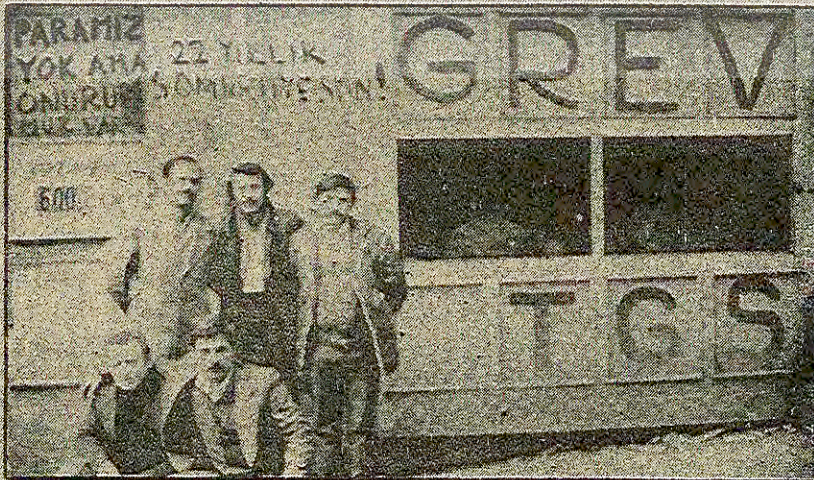
600 gündür her türlü zorbalığa göğüs geren Hayat grevçileri sonunda ancak hıdem tasminatlarını alabildiler.

«Hükümet THY grevini erteleme eğiliminde değil»