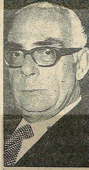
Her iki ülkenin Dışişleri Bakanları Ege Hava Sahasının sivil havacılığa açılması konusunda yaptıkları açıklamalarda, Türkiye-Yunanistan dostluğu yolunda ileri bir adım atıldığını söylediler.