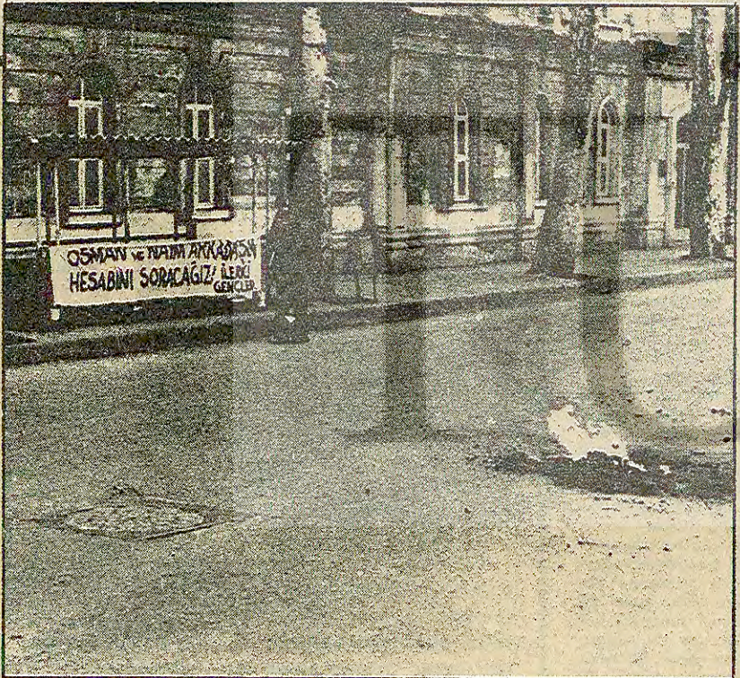
Kargaşalık için fırsat bildiler