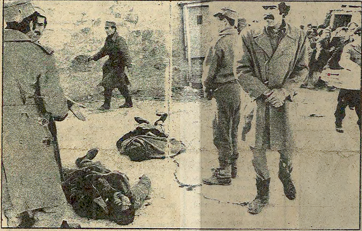
Rus işgalcileri Kabil'de ateş açtı, yüzlerce göstericiyi katletti.

TÜRKİYE ve Yunanistan hükümetlerinin, 1974 yılında konan ve Ege sivil hava trafiğini kısıtlayan notamı karşılıklı olarak kaldırmalarının yankıları sürüyor. Her iki ülke arasında var olan sorunların çözümü ve Yunanistan'ın NATO'nun askeri kanadına yeniden dönmeye ilişkin girişimlerin yoğunlaştığı sırada alınan bu karar, Türkiye ve Yunanistan'ın yanı sıra uluslararası kamuoyunda da "buzların çözülmesi yolunda atılmış bir adım" olarak değerlendiriliyor. Bilindiği gibi, Dışişleri Bakanı Hayrettin Erkmen önceki gün Millet Meclisinde yaptığı konuşmada, "Yararı olmayan bir uygulamanın başka bir ülkeye karşı tehdit aracı kullanılması doğru değildir" (Devamı sa.7, sü.1'de)