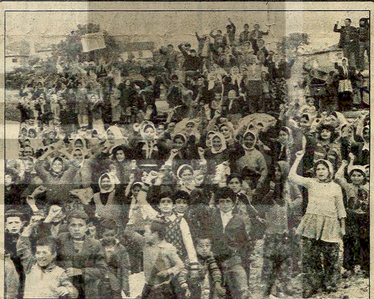
Demirci-Salihli yolunun güzergahının değiştirilmemesi için 5 bin köylünün 20 gündür sürdürdüğü mücadele başarıyla sonuçlandı. Böylelikle hem 18 köy yola kavuşmuş oldu hem de proje 200 milyon lira daha ucuza çıkacak.

Zamanın genel müdürü Gönenç'e verilen raporu yayınıyoruz CHP döneminde Tarih nasıl batağa sokuldu? CHP hükümeti zamanında Tarih'in nasıl bir partizanlık ve fraksiyon çatışması alanı. (Devamı sa. 7. s. 7'de)