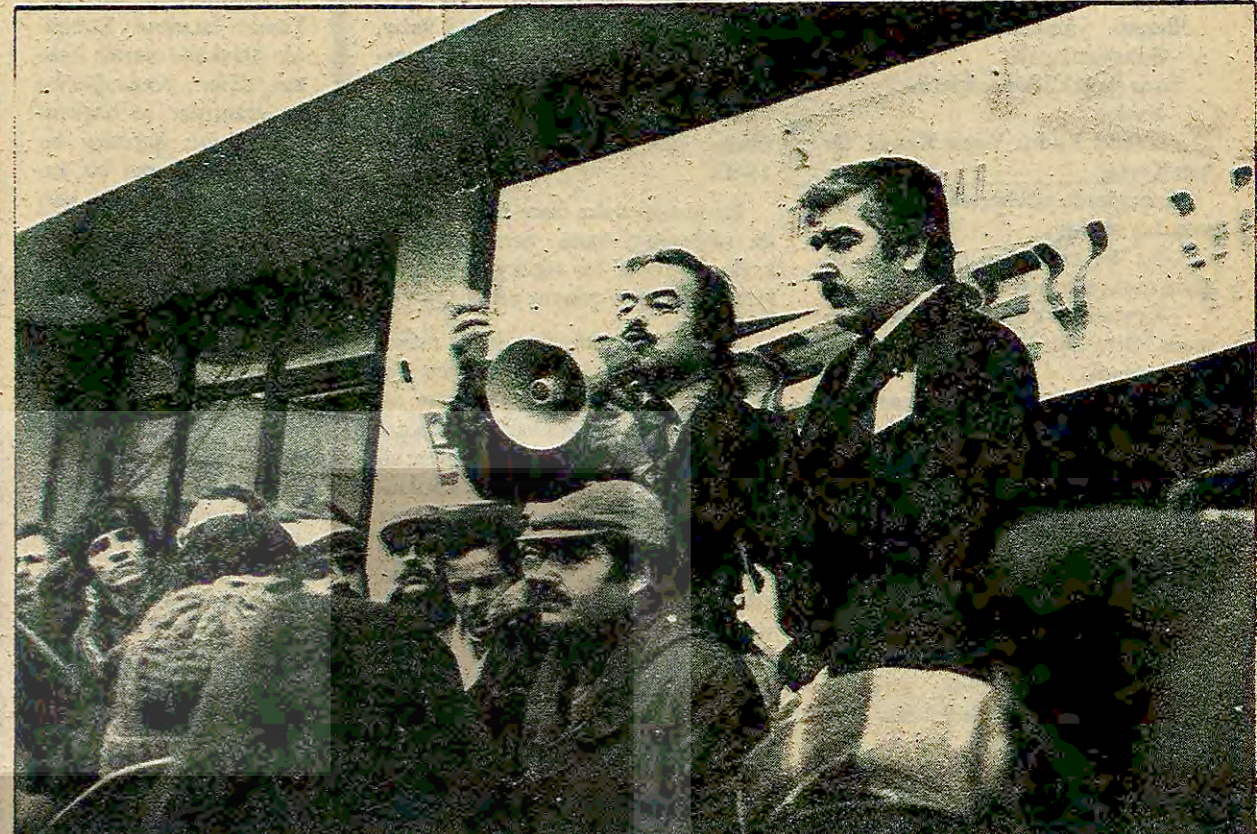
Yeşilköy Havaalanında işçilerle birlikte basın toplantısı düzenleyen Hava-İş Genel Başkanı ve Türk-İş 1. Bölge Temsilcisinin konuşmaları işçiler tarafından sık sık alkışlandı ve "Lokavta Hayır" sloganı atıldı.

İZMİR (AA) Demirci-Salihli yolu güzergahının değiştirilmesini önlemek amacıyla, 20 gündür direnişte bulunan 5 bin köylünün Çataloluk şantiyesini işgal eylemi başarıyla sonuçlandı. Karayolları 2. Bölge Müdürlüğü yetkilileri, iş makinalarının teslim alındığını ve yolun köylülerin istediği güzergahtan yapımına başlandığını açıkladılar. 20 gündür sürdürdükleri direniş sonunda haklı isteklerini kabul ettiren köylüler ise şöyle konuştular: "Eğer proje değiştirilmiş şekilde uygulanırsa, 18 köyün (Devamı sa. 7. s. 1'de)