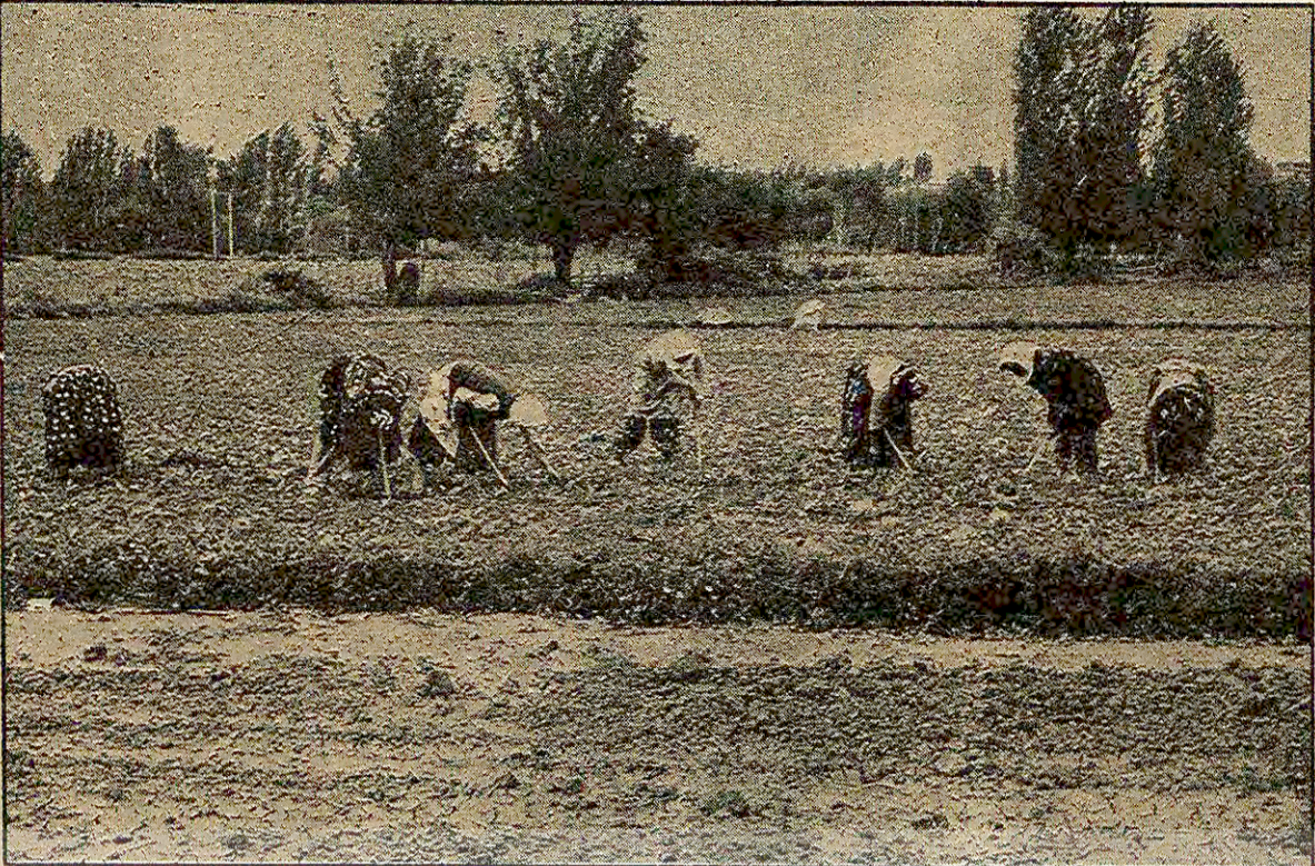
Her yıl 100-200 bin ton şeker ihraç eden Türkiye artık şeker alacak. Yakında yoklar listesine şeker de katılrsa, şaşırarak kalacağız.

İKİNCİ DÜNYA SAVAŞI SIRASINDA BİLE İHTİYACIMIZI KENDİMİZ KARŞILAMIŞTIK