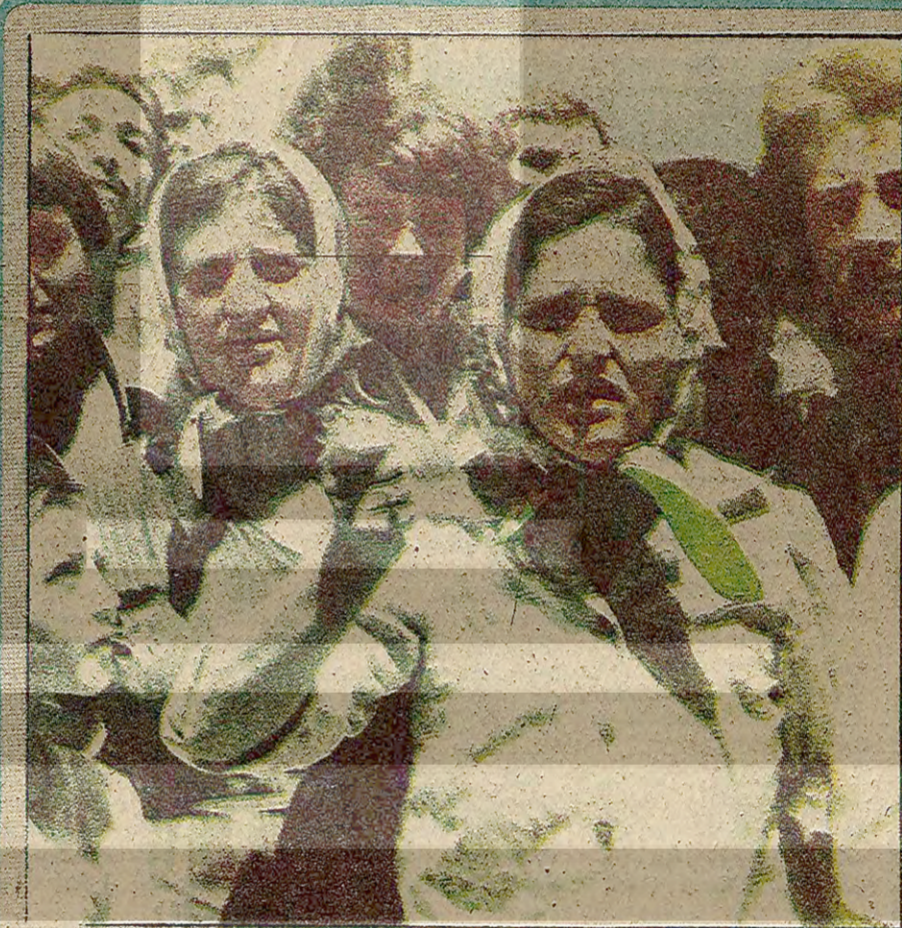
KIT işçileri yıllardır süren kıyımlara yenilerinin eklenmesinden bıktı. "İşgüvenliği ve huzur istiyoruz!" diyor

Türkiye'nin baş meselesinin anarşi ve onunla (Devamı sa. 7. s. 9'de)