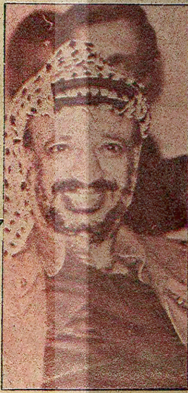
FKÖ LİDERİ ARAFAT

Arafat: «Rus ayısı susadı petrol içmek istiyor»