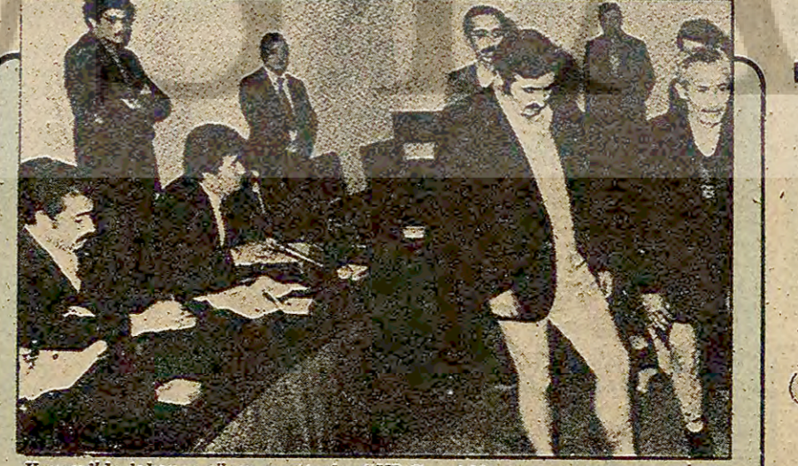
Kayseri'de işkence gören yurttaşlar CHP Genel Merkezinde işkence izlerini gösteriyorlar.