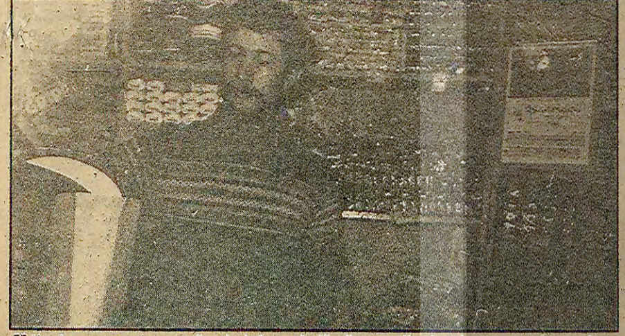
Yıllardır artan pancar üretimi bu yıl düştü ve yıllardır dışarıya şeker satan Türkiye şimdi dışarıdan şeker alacak. Fabrika var, tarla var çalışan insan var... Ama dışarıya ödeyeceğimiz döviz listesine bir de şeker eklendi.

● 1960'dan bu yana dünyaya yılda 100 ile 200 bin ton arasında şeker ihraç ediyorduk