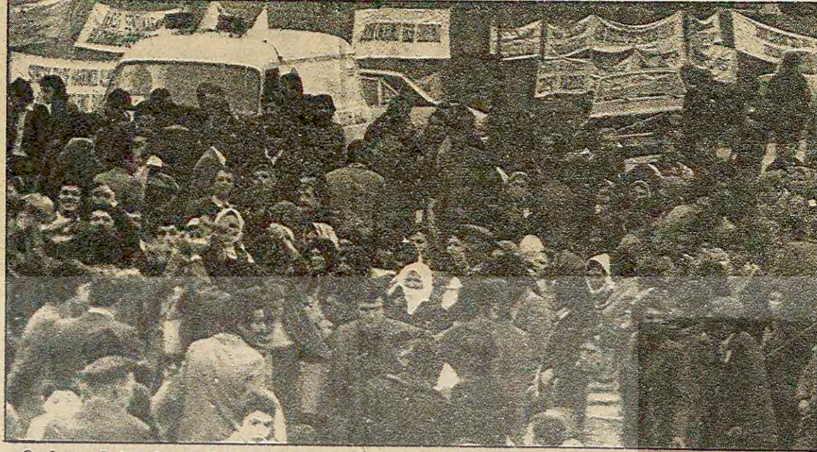
Ocak ayında imzalanan sözleşme ile birlikte nispi bir ferahlığa kavuştuklarını sanan Teksif üyesi işçiler son devalüasyondan sonra sözleşme öncesi şartlara hatta daha da geriye döndüler. İşçiler şimdi ek protokol yapılmasını ve yeni zamlar alınmasını istiyorlar.

Eski Deniz Kuvvetleri Komutanı ve Kontenjan Senatörü