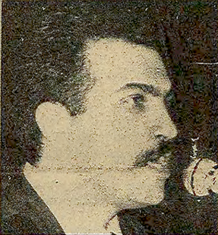
TKP Genel Başkanı Doğu Perinçek